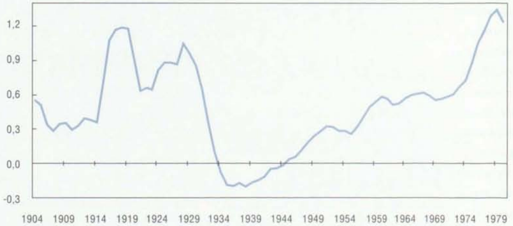
Gráfico 1 Exportaciones totales de capital privado de los Estados Unidos Promedios móviles de cinco años, 1900-1980 (Porcentaje del PNB)