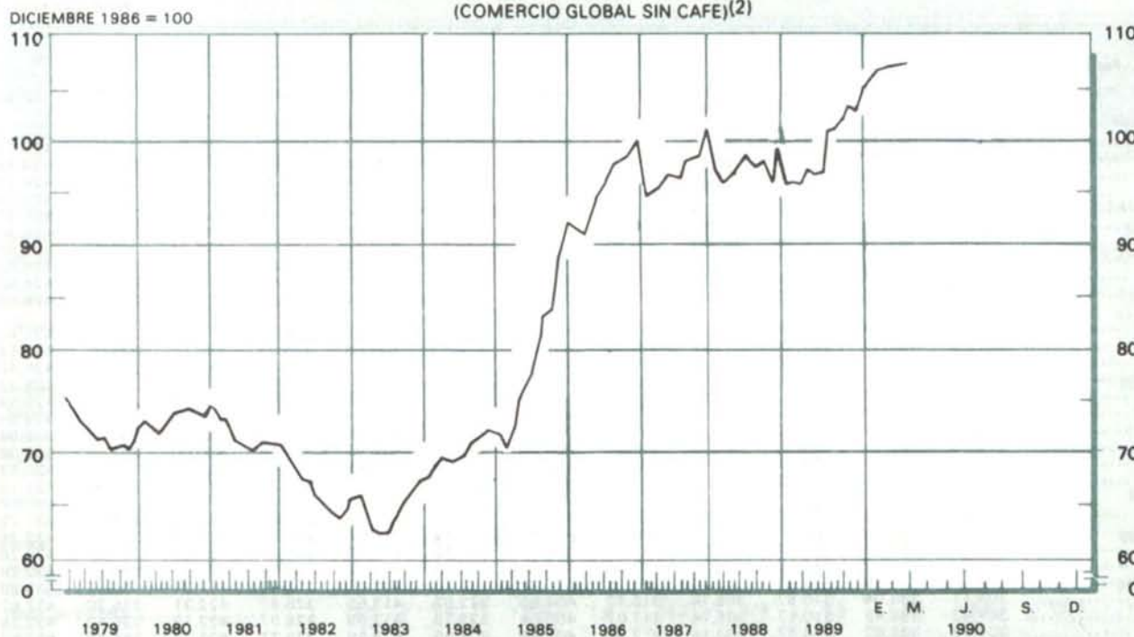
GRAFICO 9 INDICE DE LA TASA DE CAMBIO REAL DEL PESO COLOMBIANO (1) (COMERCIO GLOBAL SIN CAFE)(2)

(1) Las tasas de cambio de cada uno de los países corresponden a las del promedio de cada mes. (2) A partir de Dic./86 las ponderaciones corresponden a la participación de cada uno de los 18 países en el comercio global sin café de Colombia durante 1986. Incluye comercio fronterizo colombo-venezolano. Nota: Las cifras de la serie anterior, base Dic. 1985 = 100, se unificaron con la nueva serie a través de un empalme simple. (Ver nota metodológica en la Revista de enero de 1988).