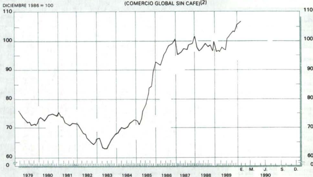
GRAFICO 9 ÍNDICE DE LA TASA DE CAMBIO REAL DEL PESO COLOMBIANO (1) (COMERCIO GLOBAL SIN CAFÉ)(2)

(1) Las tasas de cambio de cada uno de los países corresponden a las del promedio de cada mes. (2) A partir de Dic./86 las ponderaciones corresponden a la participación de cada uno de los 18 países en el comercio global sin café de Colombia durante 1986. Incluye comercio fronterizo colombo-venezolano. Nota: Las cifras de la serie anterior, base Dic. 1985 = 100, se unificaron con la nueva serie a través de un empalme simple. (Ver nota metodológica en la Revista de enero de 1988).