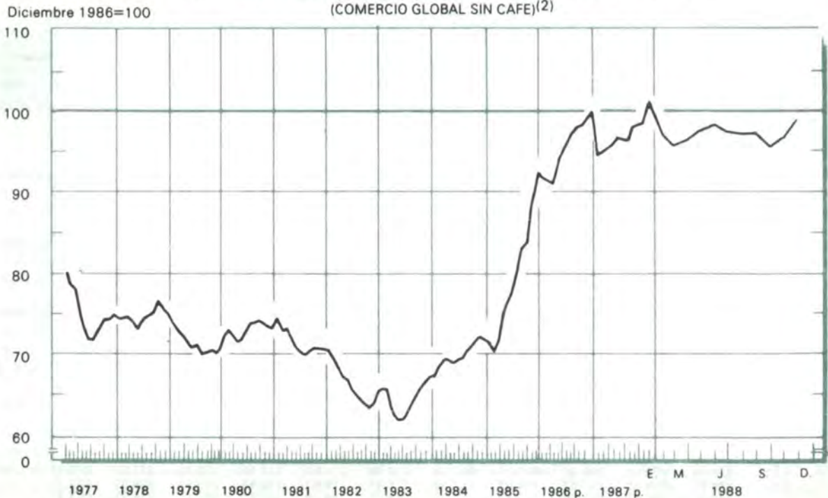
GRAFICO 9 INDICE DE LA TASA DE CAMBIO REAL DEL PESO COLOMBIANO (1) (COMERCIO GLOBAL SIN CAFE)(2)

p = Provisional. (1) Las tasas de cambio de cada uno de los países corresponden a las del promedio de cada mes. (2) A partir de Dic./86 las ponderaciones corresponden a la participación de cada uno de los 18 países en el comercio global sin café de Colombia durante 1986. Incluye comercio fronterizo colombo-venezolano. Nota: Las cifras de la serie anterior, base Dic. 1985 = 100, se unificaron con la nueva serie a través de un empalme simple. (Ver nota metodológica en esta revista).