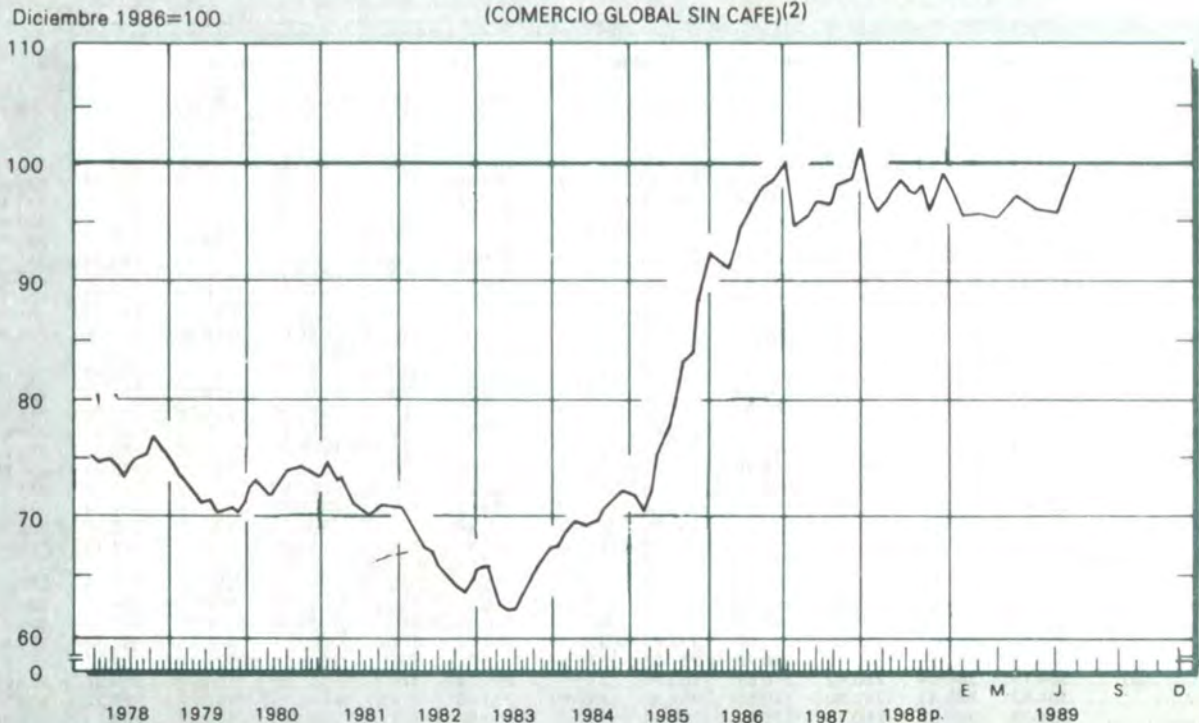
GRAFICO 9 INDICE DE LA TASA DE CAMBIO REAL DEL PESO COLOMBIANO (1) (COMERCIO GLOBAL SIN CAFE)(2)