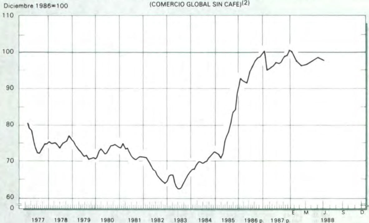
GRAFICO 9 INDICE DE LA TASA DE CAMBIO REAL DEL PESO COLOMBIANO (1) (COMERCIO GLOBAL SIN CAFE)(2)

p = Provisional. (1) Las tasas de cambio de cada uno de los países corresponden a las del promedio de cada mes. (2) A partir de Dic./86 las ponderaciones corresponden a la participación de cada uno de los 18 países en el comercio global sin café de Colombia durante 1986. Incluye comercio fronterizo colombo-venezolano. Nota: Las cifras de la serie anterior, base Dic. 1985 = 100, se unificaron con la nueva serie a través de un empalme simple. (Ver nota metodológica en esta revista).