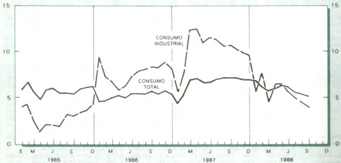
GRAFICO 11 ENERGIA ELECTRICA: CONSUMO TOTAL E INDUSTRIAL EN 24 CIUDADES VARIACIONES PORCENTUALES ANUALES*