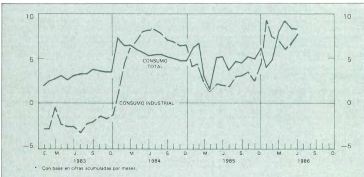
Gráfico 11 Energía eléctrica: consumo total e industrial en 24 ciudades Variaciones porcentuales anuales*