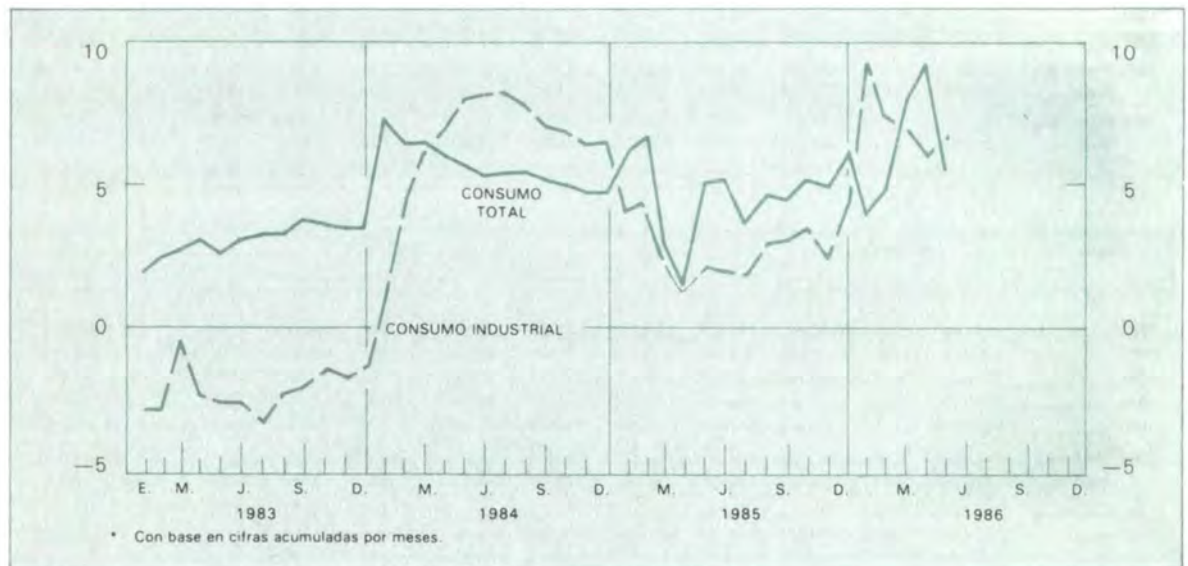
Gráfico 11 Energía eléctrica: consumo total e industrial en 24 ciudades Variaciones porcentuales anuales*

(1) Incluye la energía consumida por Quibdó. (2) No incluye ventas en bloque a otros municipios. (3) Incluye la energía consumida en el área metropolitana y otros ocho municipios, más ventas en bloque. (4) Febrero de 1986. Nota: El total incluye el alumbrado público, consumo oficial y otros.