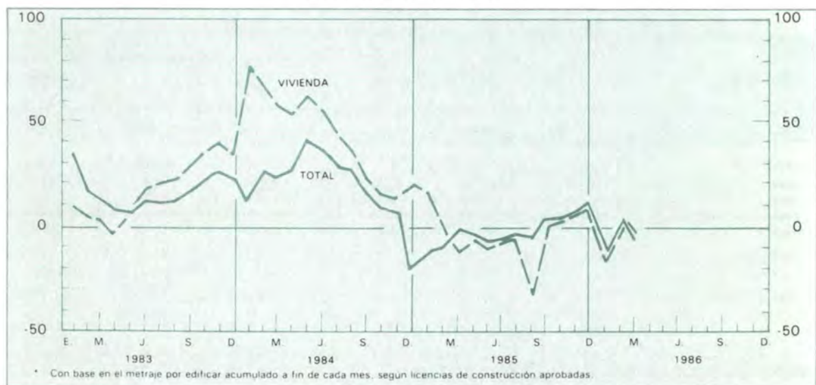
Gráfico 10 Actividad edificadora en diez principales ciudades Variaciones porcentuales anuales*

(1) Incluye los municipios de Bello, Envigado e Itagüí (2) Incluye el municipio de Yumbo. La información corresponde a metraje por edificar según licencias de construcción aprobadas.