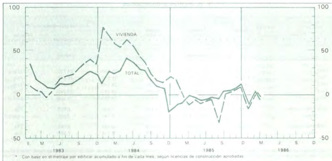
Grafico 10 Actividad edificadora en diez principales ciudades Variaciones porcentuales anuales*

(1) Incluye los municipios de Bello, Envigado e Itagüí. (2) Incluye el municipio de Yumbo. La información corresponde a metraje por edificar según licencias de construcción aprobadas.