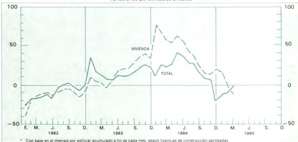
Gráfico 9 Actividad edificadora en diez principales ciudades Variaciones porcentuales anuales*

(1) Incluye los municipios de Bello, Envigado e Itagüí. (2) Incluye el municipio de Yumbo. La información corresponde a metraje por edificar según licencias de construcción aprobadas.