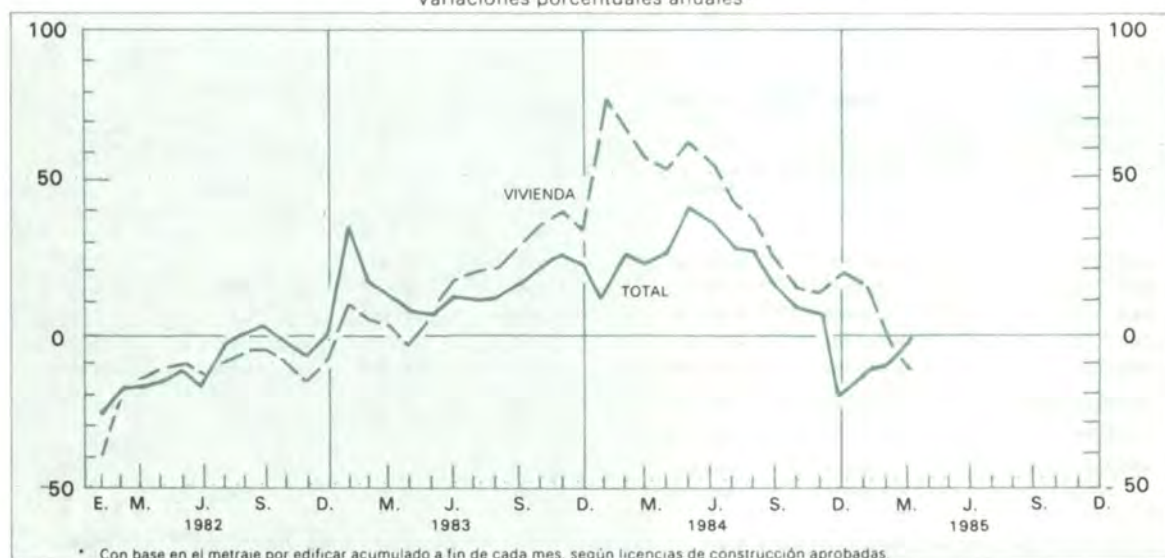
Gráfico 9 Actividad edificadora en diez principales ciudades Variaciones porcentuales anuales*

(1) Incluye los municipios de Bello, Envigado e Itagüí. (2) Incluye el municipio de Yumbo. La información corresponde a metraje por edificar según licencias de construcción aprobadas.