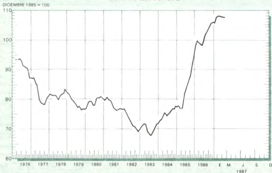
GRAFICO 9 INDICE DE LA TASA DE CAMBIO REAL DEL PESO COLOMBIANO (1) (COMERCIO GLOBAL SIN CAFE)

(1) Las tasas de cambio utilizadas para cada uno de los países que intervienen en el cálculo son las del promedio de cada mes.