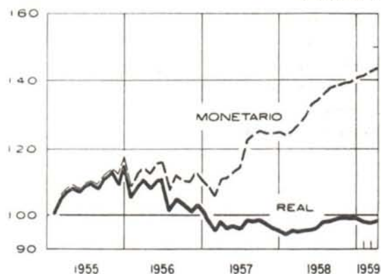
Gráfico N° 1

Al estudiar el empleo por renglones industriales, se observa que este tuvo en 1958 moderados aumentos, exceptuando los grupos de tabaco y calzado, que muestran bajas del doce y siete por ciento respectivamente. Hay también ligeros descensos de ocupación obrera en textiles, productos de caucho y minerales no metálicos.