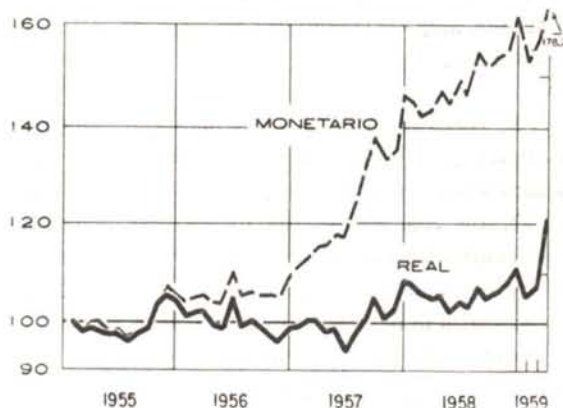
Gráfico N° 4

La ocupación se ha mantenido estacionaria en el ramo petrolero desde 1953. Son frecuentes las noticias sobre nuevas concesiones, pero al parecer están todavía en la etapa exploratoria.