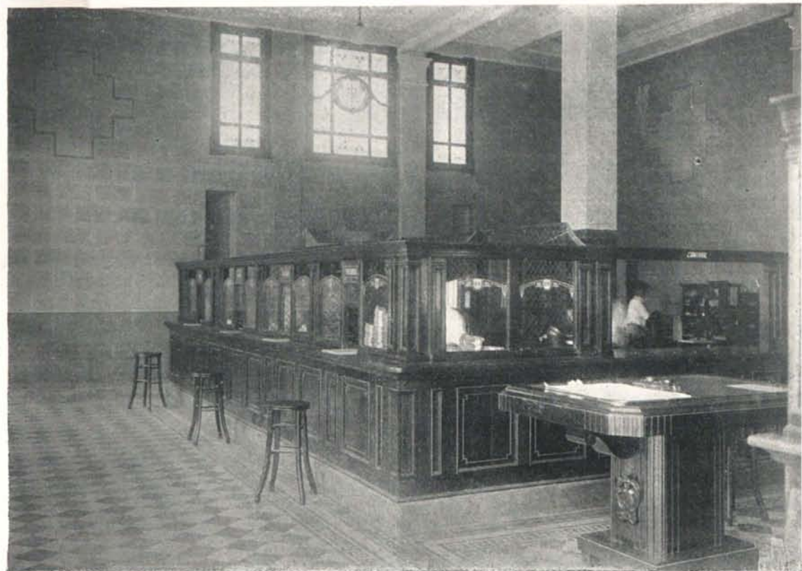
Edificio del Banco de la República en Bucaramanga. Oficinas de Caja.