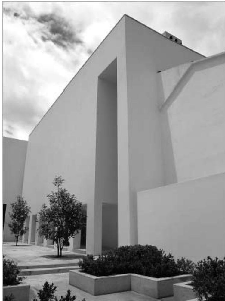
Fachada del nuevo edificio del Museo de Arte del Banco de la República en la Manzana Cultural, en Bogotá.

de la biblioteca, generó la necesidad de crear nuevos espacios para las exposiciones temporales. El Banco acometió un proyecto arquitectónico y urbanístico que implicó la reformulación de la gran plazoleta de acceso y la construcción de un museo con todas las condiciones de accesibilidad, seguridad, conservación y adaptabilidad museográfica, donde hay espacios para exposiciones temporales y, también, una exposición permanente con lo mejor del arte latinoamericano y de otras latitudes –norteamericano, oriental, europeo– en la colección del Banco.