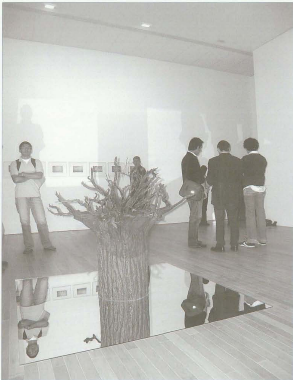
Son múltiples las exposiciones que se presentan en las salas del Museo de Arte.

directamente vinculados con su origen. La continuidad, como elemento consustancial a la actividad cultural del Banco, que