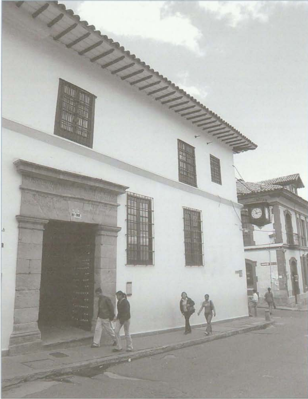
Portón de la Casa de la Moneda, que alberga la Colección Numismática.

raros y manuscritos pasaron de 9.558 a 25.320. En cuanto a contenidos, las