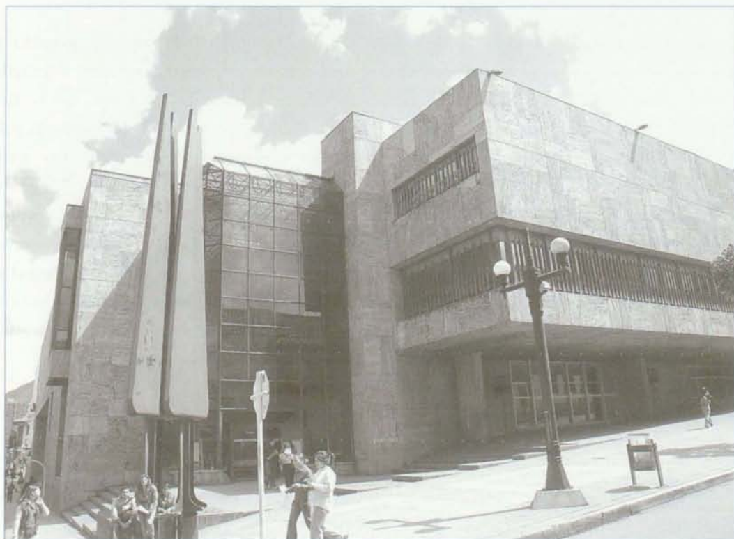
La escultura Bosque cultural de Bernardo Salcedo adorna la esquina de la Biblioteca Luis Ángel Arango.

contar la historia del arte colombiano en una exposición permanente que ocupa la antigua fábrica acuñadora de monedas.