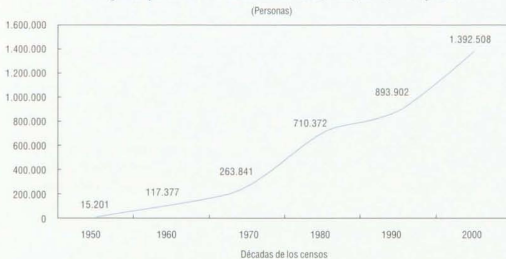
Gráfico 1 Evolución del total de emigrantes colombianos, según censos de algunos países en las décadas de 1950, 1960, 1970, 1980 y 2000