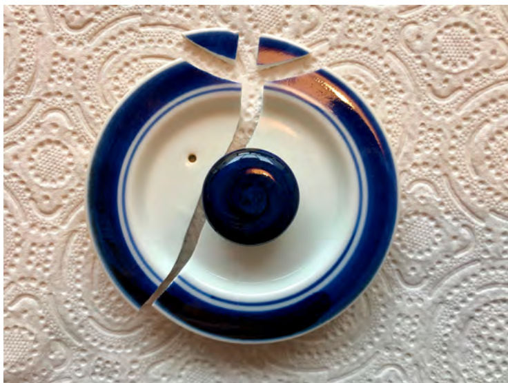
Figs. 4. Reparación de vajilla rota con kintsugi - 2018.