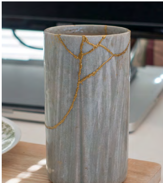
Fig. 1. Taza de té reparada con técnica de kintsugi - 2015.

Cuando la recuperó se horrorizó al ver los fragmentos unidos con unas grapas absurdas. Funcionales pero espantosas, el trabajo de cualquier remendón de barrio. Entonces encargó a los mejores artesanos del Japón (afanados por congraciarse y complacer al sogún) que le encontraran una solución a su problema. En esta tarea iba incluida la dignidad, y también el honor, de los mejores alfareros del Japón, en un mundo en el que esas palabras todavía tenían algún sentido más allá del diccionario. Palabras importantes dentro de un mundo de ilusiones, tal vez inútiles, pero en las que se les iba la vida a los habitantes de ese archipiélago en ese momento de la historia. Los artistas-artesanos (en ese entonces no existía la separación entre los dos conceptos) encontraron un método que no intentaba disfrazar el daño, sino que por el contrario lo realzaba, mediante las potentes alquimias del arte. Un método substraído del yugen no sekai , del mundo de lo profundo y lo misterioso, cargado de mu y de wabi sabi : el kintsugi .