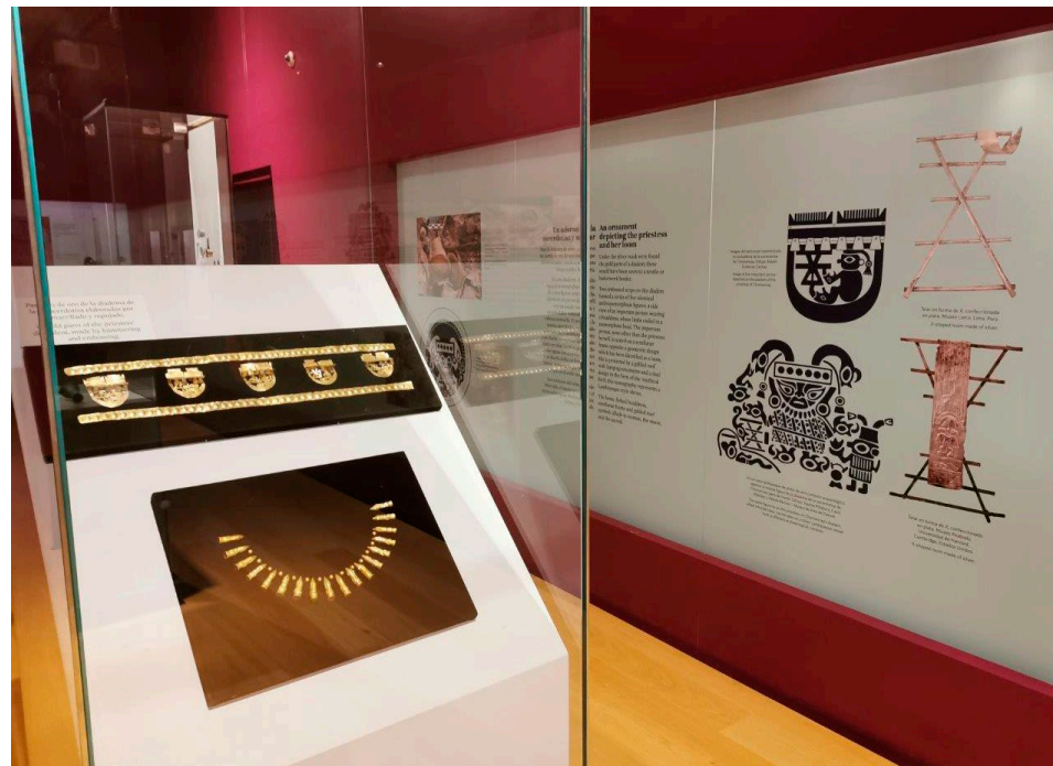
Fig. 3. Aspecto de la exposición temporal.

Entre el 9 de enero y el 9 de mayo de 2021, el Museo del Oro del Banco de la República, el Ministerio de Cultura del Perú y el Museo Arqueológico Nacional Brüning exhibieron en Bogotá elementos procedentes de la tumba de la sacerdotisa de Chornancap –uno de los hallazgos arqueológicos más importantes de los últimos tiempos–, entre ellos piezas de oro, plata y cerámica. El rico ajuar funerario y su iconografía demuestran el rol principal de la mujer en Perú y en América del Sur hace siete siglos. Esta exposición temporal recrea la historia de la mujer de mayor jerarquía en la cultura lambayeque encontrada hasta el momento, en un triunfo de la arqueología científica sobre el saqueo del patrimonio.