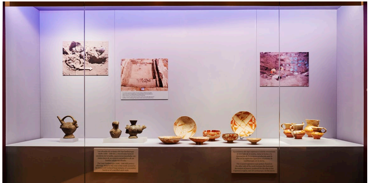
Fig. 5. Aspecto de la exposición temporal.

Entre el colapso de la cultura mochica y el inicio de la cultura chimú, los lambayeques ocuparon gran parte de la desértica costa norte del Perú, gracias a un extenso sistema de canales de irrigación que conectaba los valles desde Motupe –al norte– hasta Jequetepeque –al sur–. Además de agricultores de maíz, frijol, ají y otros cultivos, los lambayeques fueron diestros artesanos, arquitectos y navegantes. Su organización social estaba basada en linajes familiares jerarquizados que se establecían alrededor de centros administrativos y ceremoniales con pirámides y arquitectura monumental en adobe. Desde allí, gobernantes con poder político y religioso coordinaban la sociedad y distribuían bienes rituales y de prestigio.