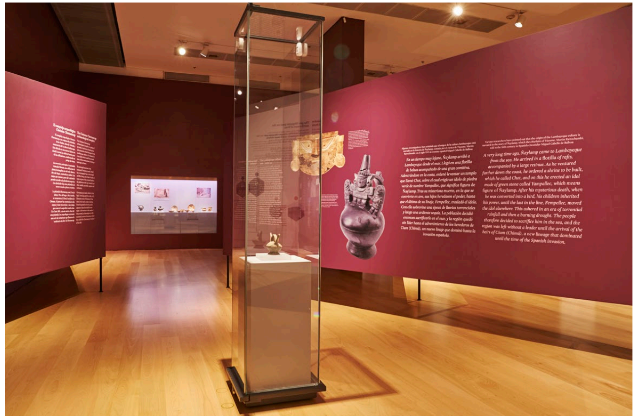
Fig. 2. Aspecto de la exposición temporal.

Del Perú llega a Colombia la extraordinaria narración de una sacerdotisa que vivió hace 700 años, de su pirámide, de su tumba real y de su excavación científica por arqueólogos peruanos. La arqueología, de la mano del arte orfebre de la gente lambayeque, nos permite conocer en detalle un mundo pasado cuyo esplendor impactará para siempre nuestra imaginación.