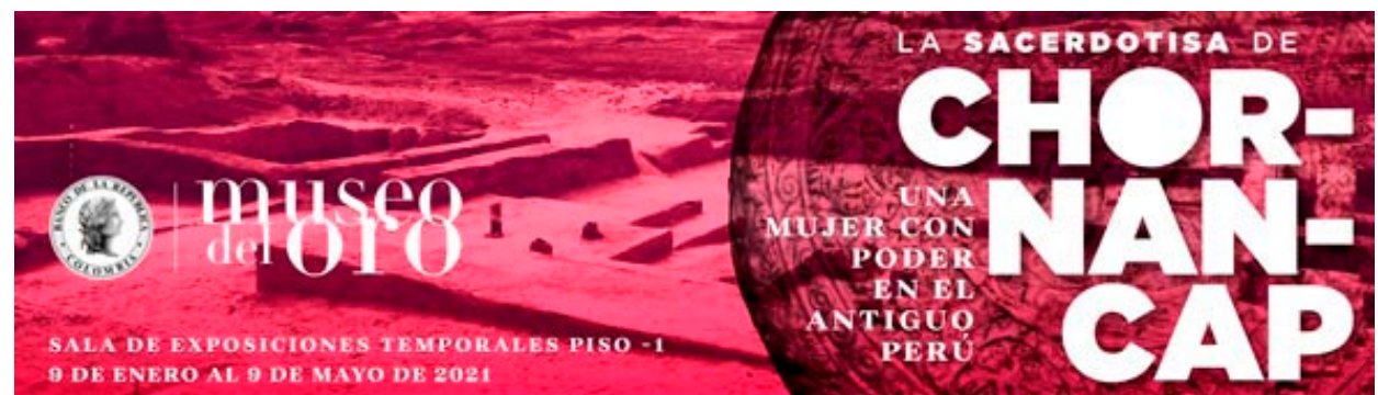
Fig. 4. Footer de divulgación de la exposición temporal. Diseño Gráfico: Neftalí Vanegas.

En 2011 tuvo lugar uno de los más notables entre estos descubrimientos: el de la tumba de la sacerdotisa de Chornancap, quien ostentó un gran poder político y religioso en la cultura lambayeque, datada entre los años 800 y 1350 d.C. La tejedora de vida, asociada a la luna, fue enterrada en compañía de ocho mujeres de entre 15 y 20 años. Su cuerpo estaba cubierto con dos mantos con aplicaciones de discos lunares de cobre decorados con la ola mítica de esta cultura asociada al mar. En la decoración de su diadema se la ve sentada frente a un telar, sobre una media luna y protegida por un techo a dos aguas que representa su templo.