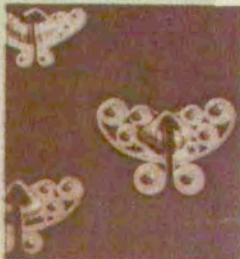
Украш за очи: сваки део чела је украшаван лачком.

Једном сазнали случај- но извесном отаџом на обали језера. Зашто је злочотки дрхтао, већ извеснога легенда о Ел- зорату. Бараташки су с неисправног упорозити