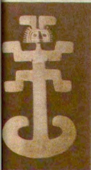
Из дрвета Иланда су били носили на грудима.