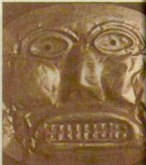
Посрпна маска од тавар злата која се савладала на лице узрало поглава

Било је то језеро Гуамати, а онај обред су чак, подробно списали текм шпанског хроничари. Шпанци су, тог