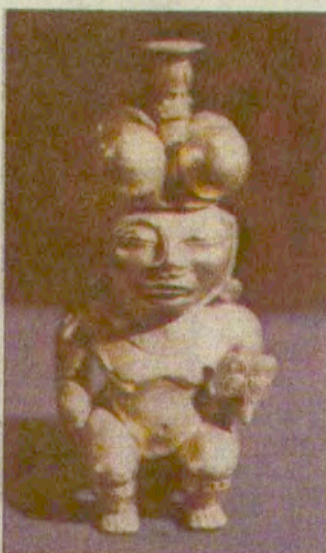
Прве керамичке фигурине створиле су легенде о Елзороду.