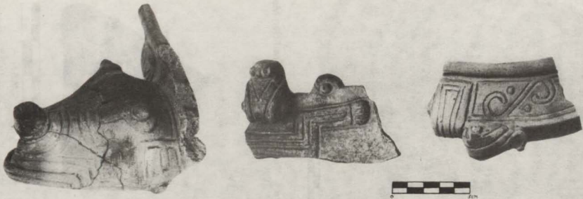
Figuras 1-2-3. Decoración modelada incisa. Tradición Malambo.