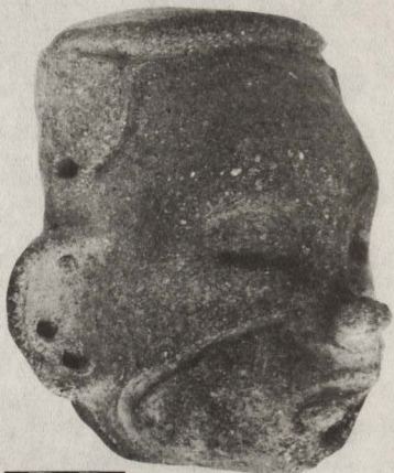
Figura 4. Mascarilla de arcilla. Tradición Malambo.