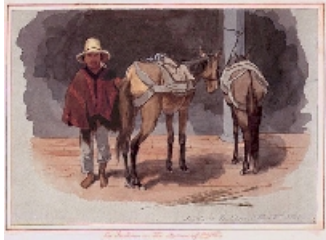
Indio de Foribón en 1845. Acuarela de E. W. Mark, colección de arte del Banco de la República, Biblioteca Luis Ángel Arango. 14,9 x 25 cm. En el borde inferior derecho está anotada a lápiz: "Indio de Foribón, Oct. 22nd 1845" y en el cartón de soporte, en tinta, "An Indian on the Savana of Bogotá".

Resumen: para introducir el documento de 1563 sobre las ceremonias muisca en Ubaque se hace un resumen cronológico de la conquista española y una contextualización del evento en la época colonial. Bajo la forma de una fábula de animales se invita a cambiar los métodos con los cuales la etnohistoria muisca ha analizado las crónicas y documentos de archivo. Se sugiere a quienes utilicen textos como el de Ubaque no limitarse a extraer y copiar citas sino realizar un análisis del contexto colonial de enunciación de esos textos.