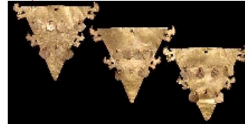
Colgante triangular con placas colgantes, de estilo muisca. Nuevo triángulo y dos pares de colgantes de ovajera circular conforman un conjunto procedente de Ubaque. Aunque se encuentran en una tumba, es probable que los triángulos no sean pastorales sino adornos para un tejido u otro objeto.

A propósito del proceso seguido al cacique de Ubaque por idolatría