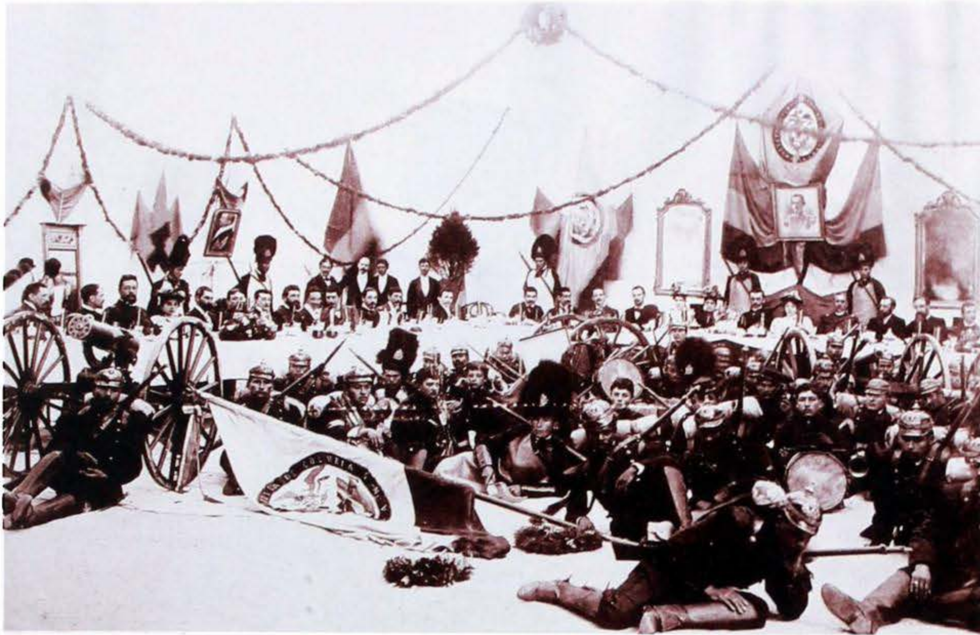
Banquete en tiempo de guerra, fotografía de Henry Duperly, Bogotá, c 1900 (tomada de: Eduardo Serrano, Historia de la fotografía en Colombia , MAM, Bogotá, 1983, pág. 169).

anatemas latinos. La división y la insubordinación fueron de nuevo manifiestas a finales de la década de 1920 20 .