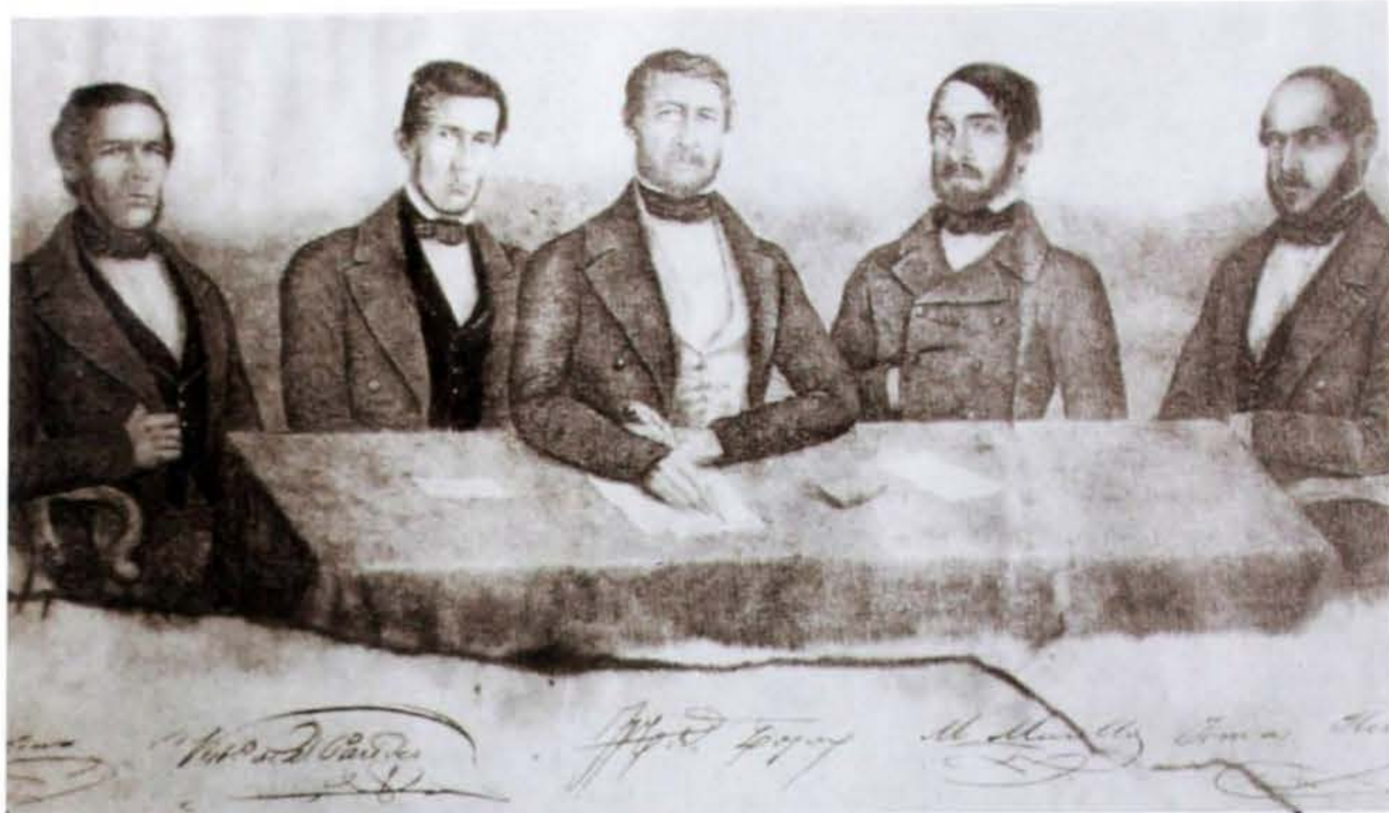
José Hilario López y su gabinete ministerial: Francisco Javier Zaldúa (Gobierno), Victoriano Diego Paredes (Relaciones Exteriores), Manuel Murillo Toro (Hacienda) y Tomás Herrera (Guerra).

miento que restableció el reconocimiento oficial hasta un punto desconocido en otros lugares de Hispanoamérica, y hasta 1930 los dirigentes conservadores del país pudieron ver a Colombia como una isla de ortodoxia rodeada de un mar de herejía e indiferencia. También lo hicieron sus opositores, aunque con palabras diferentes.