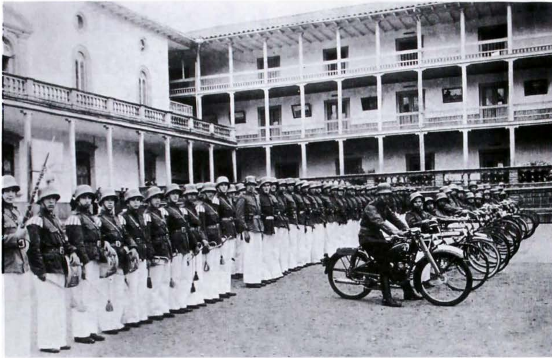
Batallón Colegio Champagnat, 1935.

der, la segunda permaneció débil y la tercera no tuvo defensas contra la manipulación sectaria hasta que pasó a depender del Ministerio de Guerra durante el corto gobierno militar de 1953-1957. El aprendizaje electoral de Colombia fue particularmente largo y doloroso. Precisamente por eso, muestra de manera particularmente aguda ciertas facetas y problemas en la evolución electoral, comunes a otras formas de gobierno.