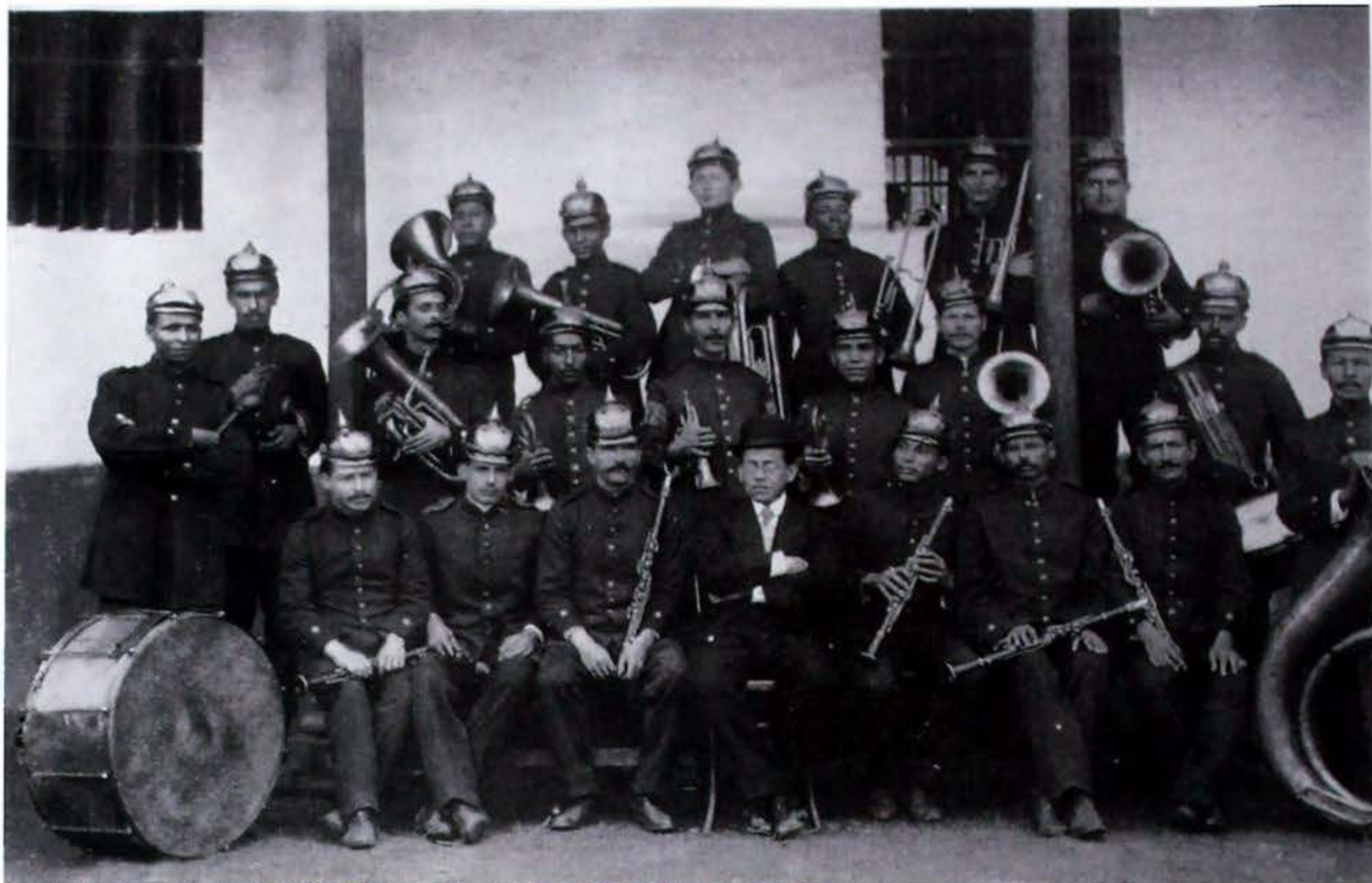
“Banda del Regimiento Ayacucho”, c 1919 (de: Benjamín de la Calle, fotógrafo , Medellín, pág. 81).

mación; los críticos decían que se debía permitir, al menos, que los soldados votaran individualmente o en pequeños grupos, de manera que tuvieran la oportunidad de votar libremente. El gobierno respondía con circulares inaceptables que prohibían absurdamente a los oficiales ordenarles a sus hombres cómo votar, y defendían la votación en formación alegando que era necesario mantener el orden público durante el periodo electoral, que generalmente era una época de tensión. El voto militar en sí mismo era de vez en cuando causa de desórdenes callejeros 29 .