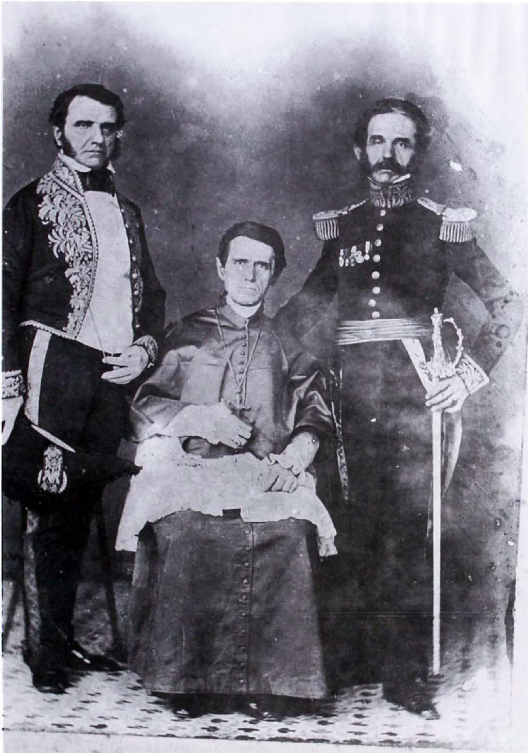
Tomás Cipriano de Mosquera, a la derecha, y al centro su hermano Manuel José, arzobispo de Bogotá, retratados en Nueva York, 1853.