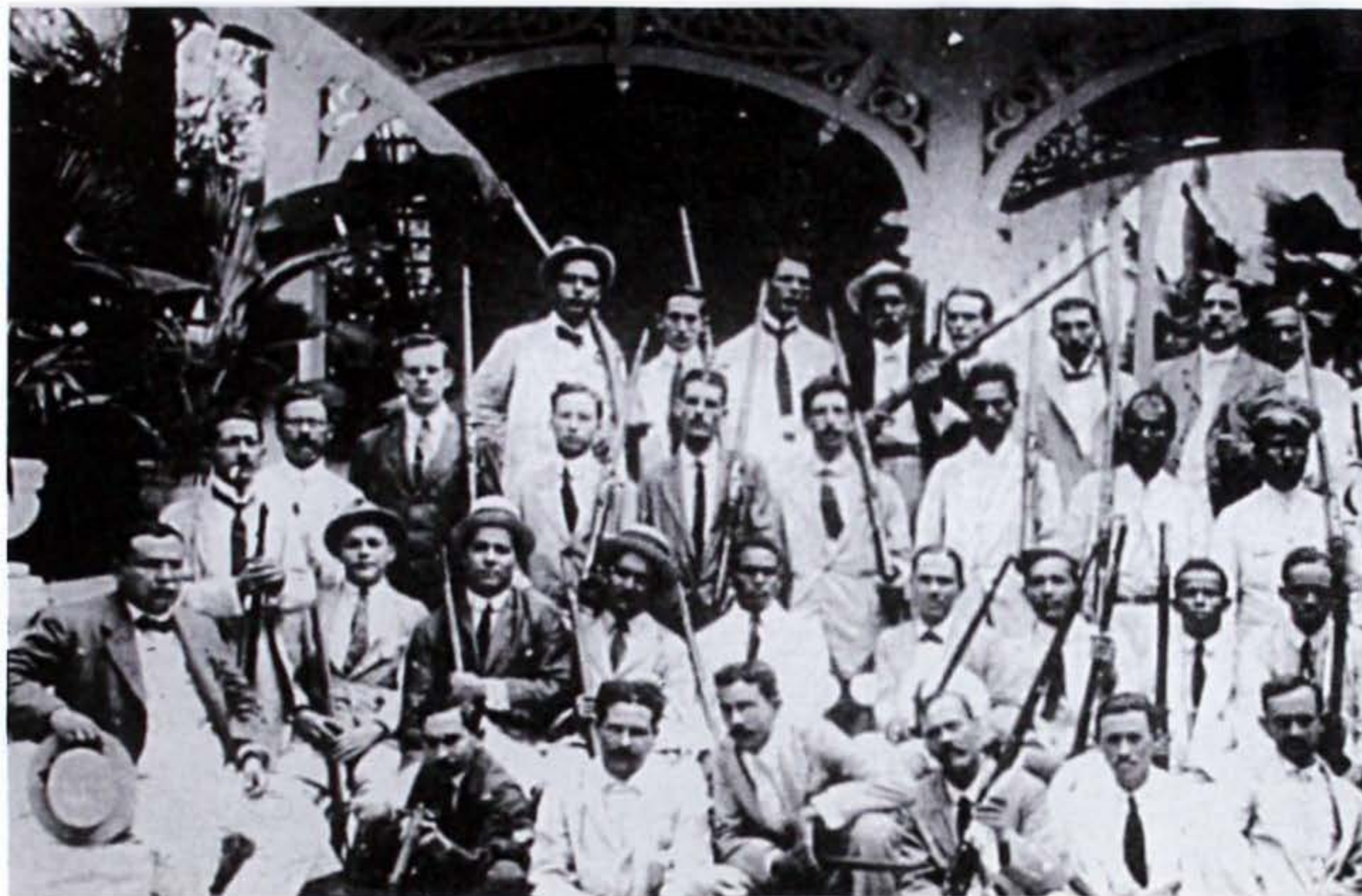
El batallón reunido en el Club Popa, 1930 (en: Memoria visual y vida social de Cartagena, 1880-1930 , Bogotá, 1998).

rias”, y con fuerzas del orden esqueléticas, mantener el orden y ofrecer garantías mínimas planteaban problemas serios en la conducta práctica de las elecciones pacíficas que no habían recibido la debida atención. Durante los dos decenios que siguieron al final del mandato de Reyes en 1909 fue cada vez más común que las autoridades locales solicitaran destacamentos del ejército para ayudar a conservar el orden durante el período de elecciones. De acuerdo con los archivos del Ministerio de Gobierno, es claro que estas solicitudes no eran para que las tropas votaran o ejercieran la fuerza; lo que se solicitaba era la presencia de una fuerza neutral reconocida. Se ve a menudo que lo que se quería era simbólico; hubiera bastado incluso un sargento o un cabo y dos o tres soldados. A pesar de la resistencia inicial de los militares, con frecuencia el gobierno hace todo lo posible por cumplir 30 .