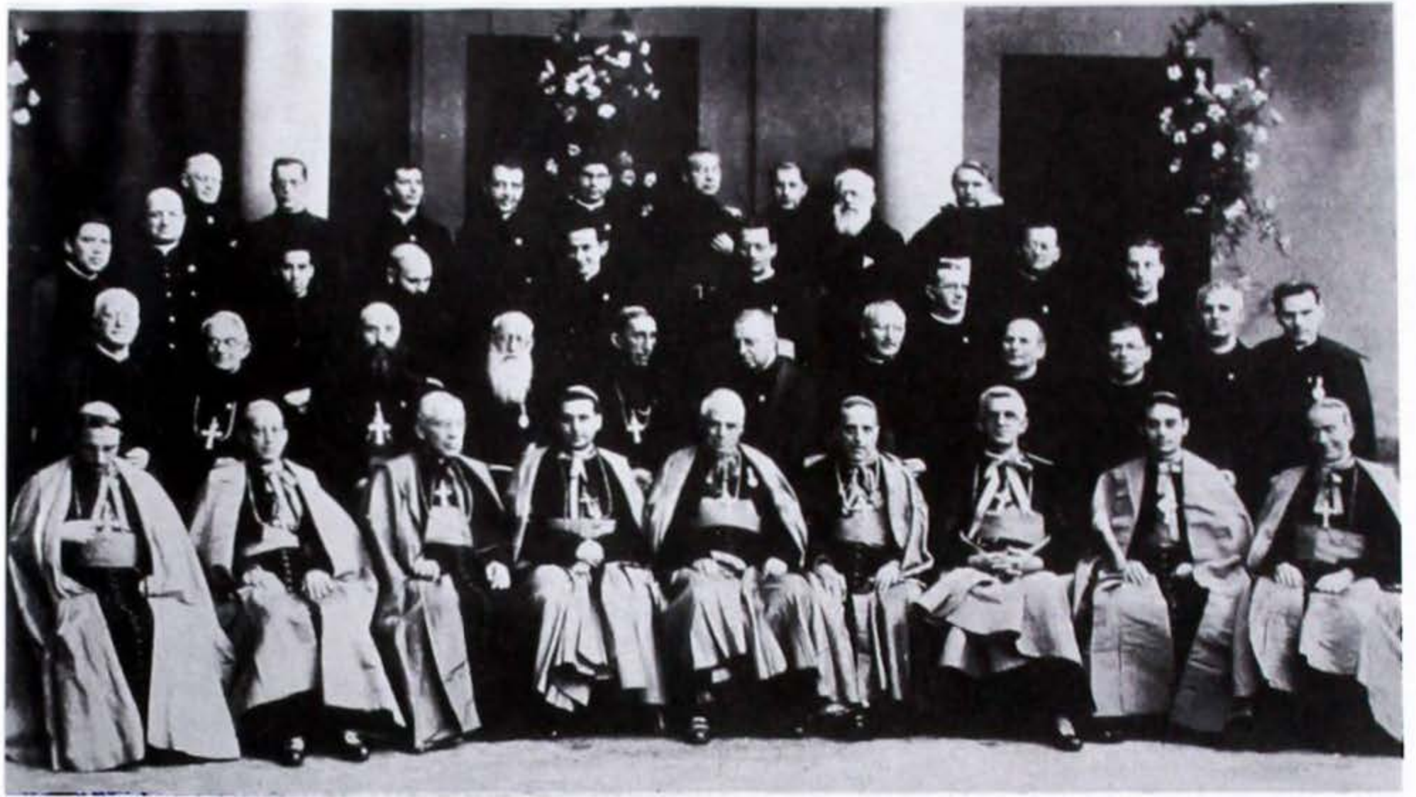
Prelados que asistieron al II Congreso Eucarístico Nacional, Medellín, 1935, retratados por Francisco Mejía (tomada del catálogo sobre este fotógrafo, Banco de la República, 1986).

dico que registra los resultados de ese cambio a un predominio liberal en la región de García Rovira se cuida de hacer la distinción entre la policía departamental y los guardias de renta (monopolio del licor), la policía nacional y los destacamentos del ejército. La policía departamental y los guardias son abiertamente políticos, agentes reclutados para “liberalizar” la región. La policía nacional es, en cierta manera, preferible, pero la única posibilidad real de “garantías” la ofrece el ejército. Esta percepción no parece deberle mucho, si acaso le debe algo, a una supuesta lealtad conservadora entre sus oficiales, sino a su divorcio de la maquinaria política local, a su estatus nacional, a su sentido del honor y de patria 31 .