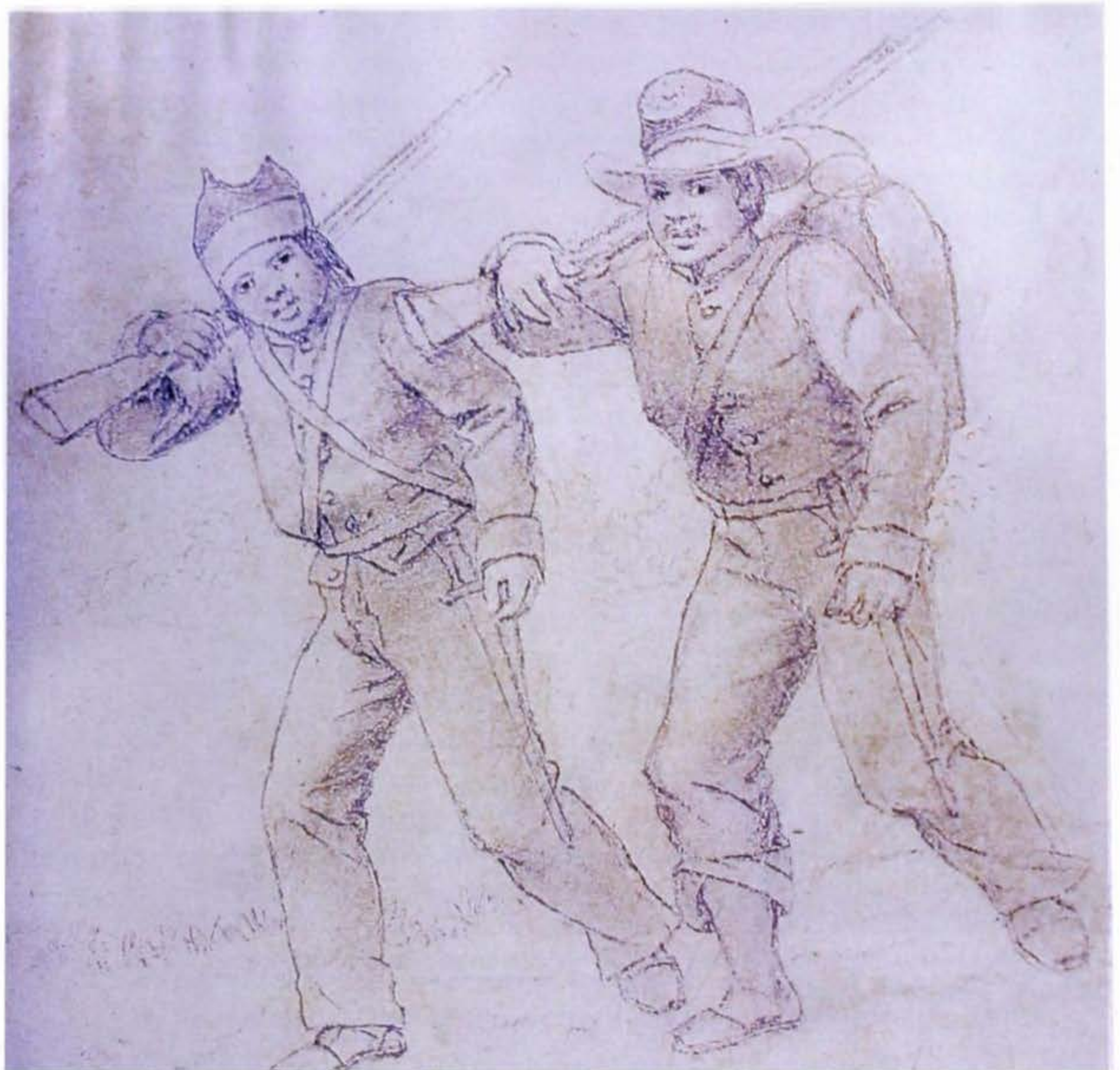
Recluta y soldado de infantería durante la revolución de 1876, vistos por Ramón Torres Méndez (en: Caricatura y costumbrismo , catálogo exposición Museo de América, Madrid, marzo-abril, 1999).

La conducta del alto clero también se examina a fondo y no alcanza los estándares prescritos por el papa. Un jesuita en Chapinero, el elegante suburbio de Bogotá, tuvo el mal gusto de predicar contra los liberales, “dejando estupefactas a las buenas y piadosas mujeres que lo escuchaban. A la misma hora moría en Roma su santidad Benedicto XV, el autor de esa memorable encíclica que prohíbe hacer del púlpito una plataforma de partido, una encíclica que, triste es decirlo, nunca obedecieron ni obedecen ahora los curas de parroquia”. La carta pastoral del arzobispo de Medellín advierte que es un pecado mortal votar por alguien cuyas ideas religiosas inspiren sospecha o sean desconocidas: “la circular está escrita con ingenio y no contiene recomendaciones expresas. Desde luego ataca la candidatura del general Herrera”. Mucho menos prudente fue la respuesta del obispo de Tunja a una entusiasta recepción conservadora: “El prelado respondió a los discursos con una encendida arenga política que despertaba su fervor y terminaba gritando viva al partido conservador y al general Ospina, según El Nuevo Tiempo 12 . Ésta es, según entiendo, la primera vez en la que el príncipe de la Iglesia, desde el balcón de su palacio, adopta tal actitud y presenta tal espectáculo a sus feligreses, la mayoría de los cuales son liberales” 13 .