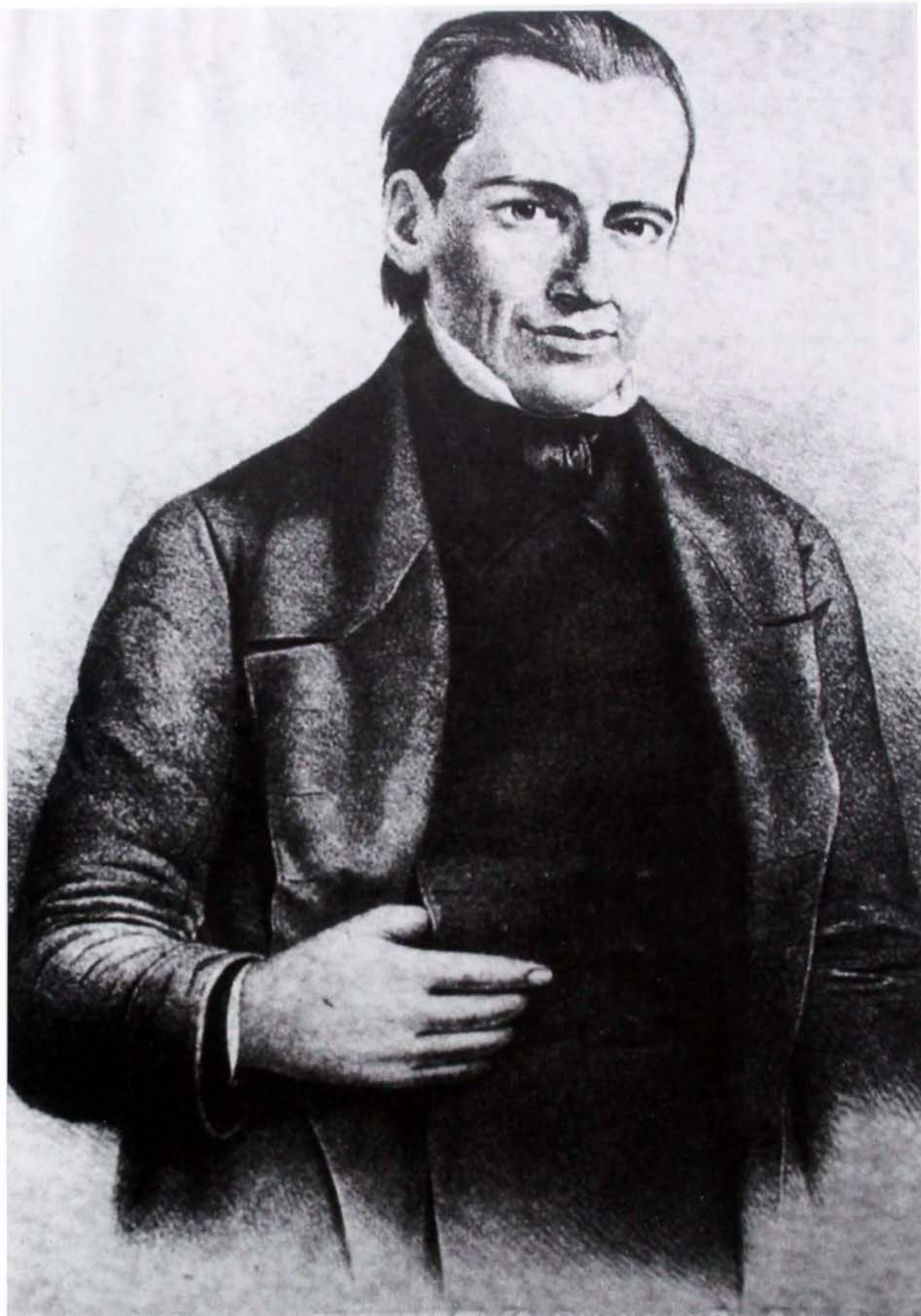
Mariano Ospina Rodríguez según un grabado de la época (tomado de: Historia de Colombia , vol. 13. Bogotá, Editorial Salvat, pág. 1445).

lealtad personal o geográfica (es ampliamente aceptado que las simples categorías sociológicas no son muy útiles para explicar las afiliaciones políticas).