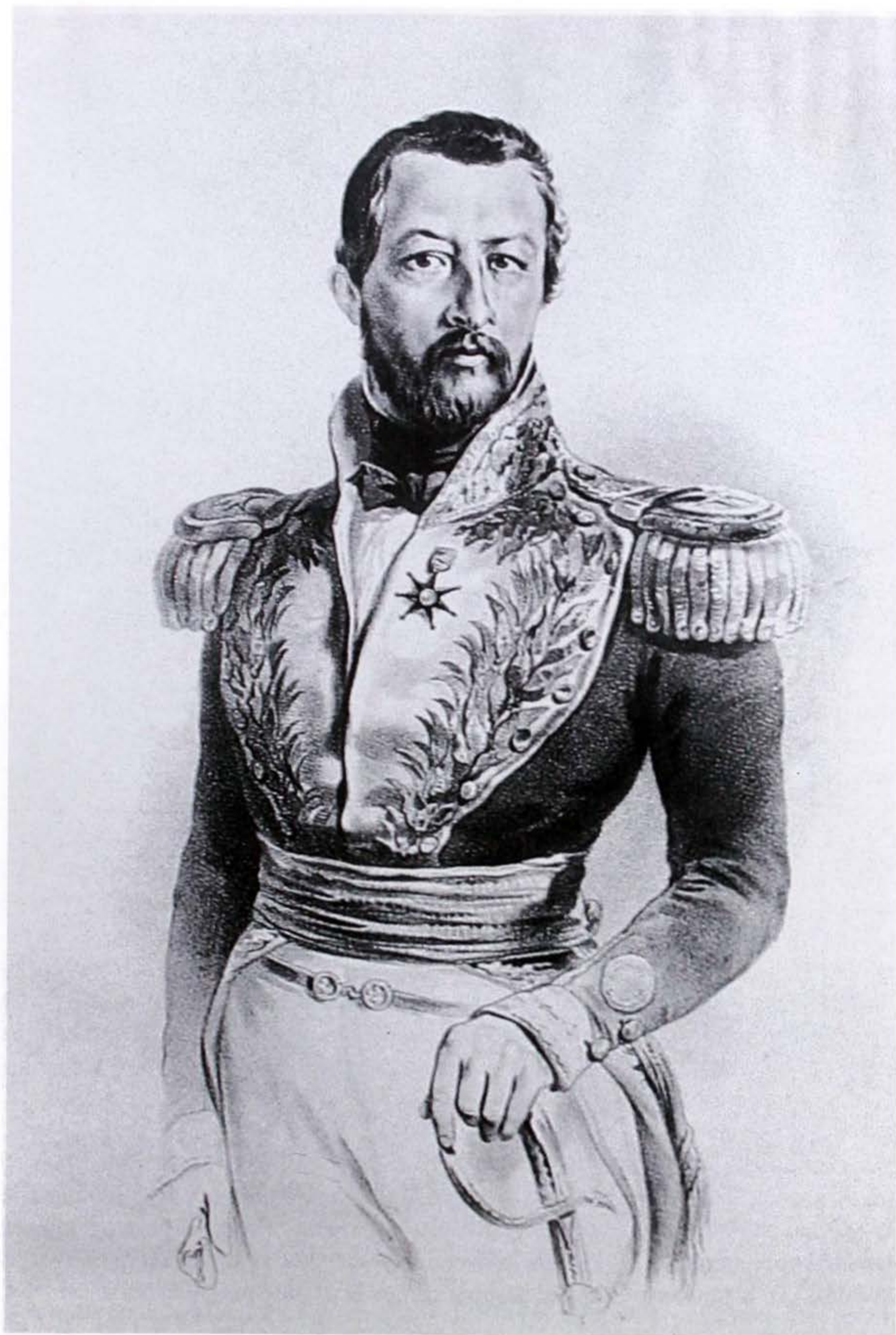
General José Hilario López, c. 1843. (reproducido en: Beatriz González, José María Espinosa. Abanderado del arte en el siglo XIX , Bogotá, 1998, pág. 34).

quier control de la Iglesia de una manera que anticipa el posterior anticlericalismo republicano 3 . Sin embargo, en las montañas habitadas por la mayor parte de la población nativa que había sobrevivido a la conquista, y donde se encontraba aún la mayoría de la población de la república, la Iglesia tenía algo más que la pretensión retórica de ser la institución en la que se fundaba la sociedad. Durante la república se enfrentó con una serie de persecuciones por parte de los liberales, en el curso de las cuales perdió propiedades y sufrió espectaculares oprobios: la abolición de los diezmos, la expulsión de obispos y del clero regular, la supervisión estatal del culto, una Constitución que no mencionaba a Dios. Después de 1885 se llegó a un acerca-