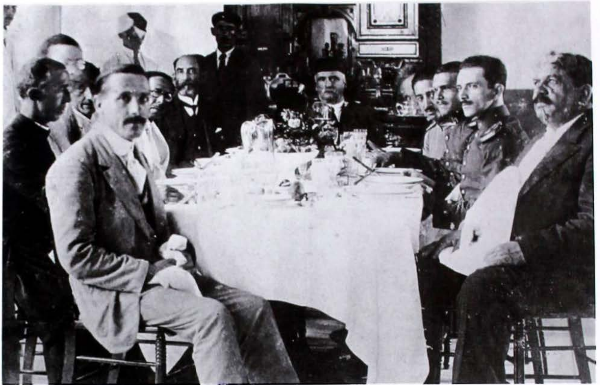
Visita del general Rafael Reyes a Santa Marta, s. f. fotografía de autor anónimo ( La historia de Santa Marta a través de la fotografía , Bogotá, 1993, pág. 43).

En Colombia, desafortunadamente, no ha sido posible alcanzar un acuerdo que termine de una vez por todas con los conflictos entre la Iglesia y los partidos. Hay dos razones para ello: el primero es el concepto exagerado que los prelados y el clero en general tienen de su propio poder e influencia sobre las masas. Esta exageración les da la arrogante confianza que les hace subestimar los peligros de los cursos de acción extremos. La segunda razón es la adhesión interesada del partido conservador a la Iglesia y el apoyo que la Iglesia le da en consecuencia en todas sus empresas 26 .