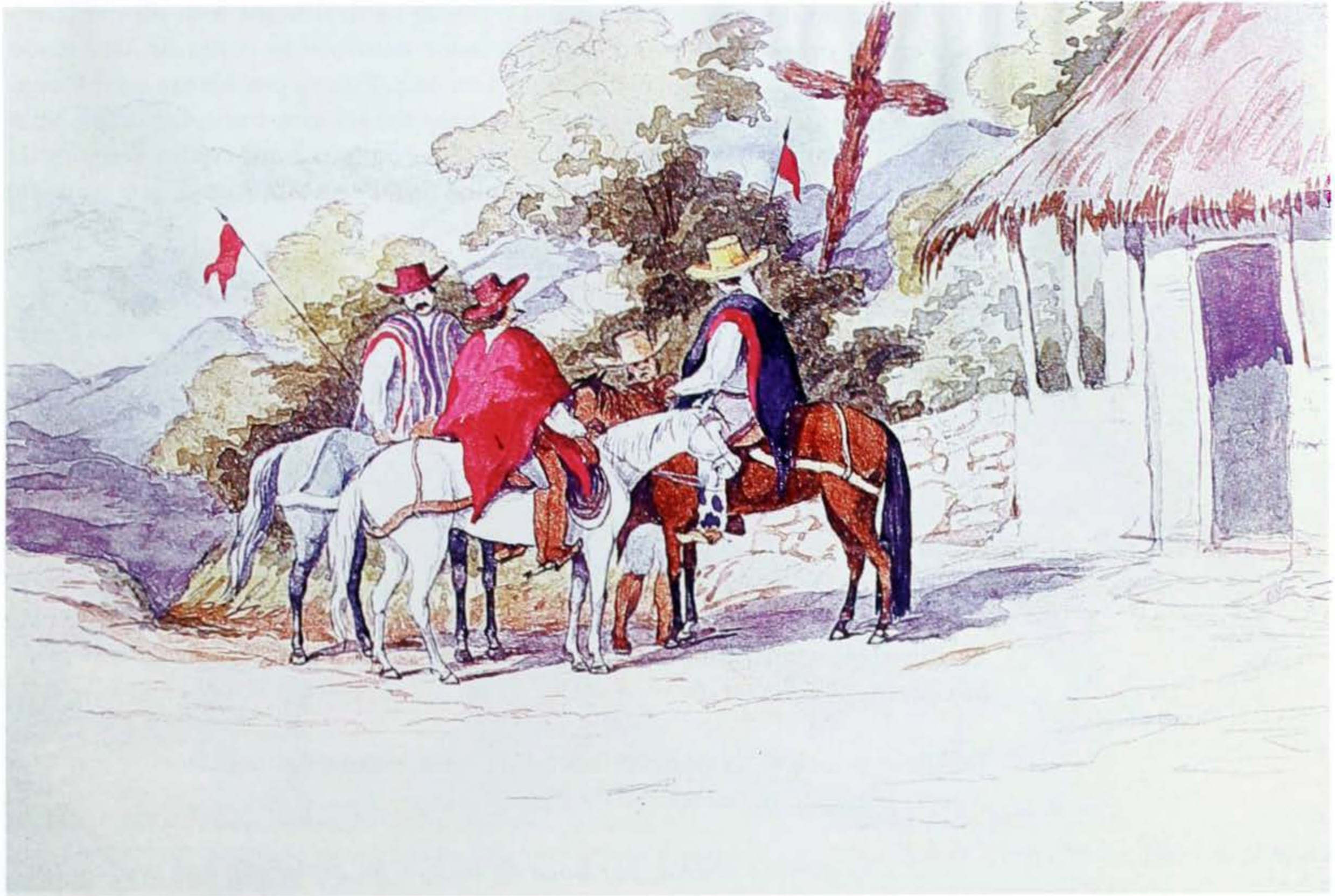
"Milicias neogranadinas", c. 1840 (tomado de: Edward Walhouse Mark, Acuarelas , Bogotá, 1997, pág. 99).