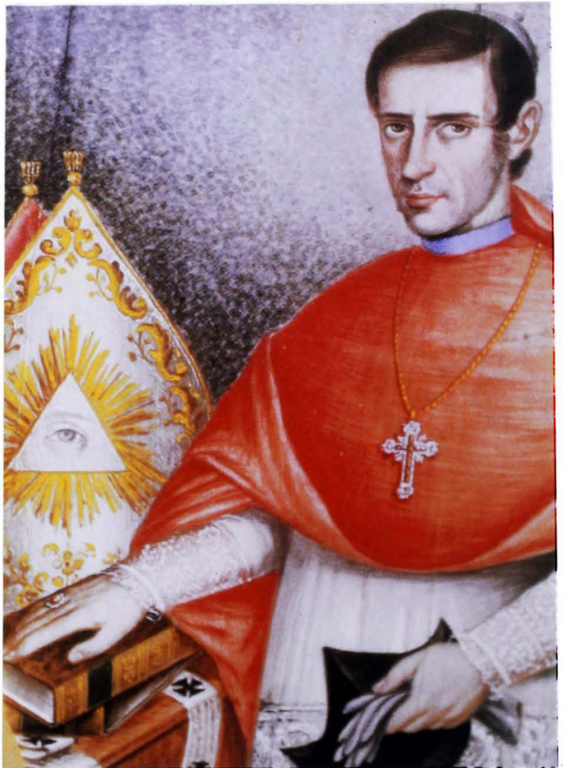
Arzobispo Manuel José Mosquera, c. 1840 (reproducido en: Beatriz González, José María Espinosa. Abanderado del arte en el siglo XIX , Bogotá, 1998, pág. 89).

mente directa y sanguínea, después de exponer, citando muchos ejemplos franceses, el argumento en su contra: que entregaba el poder a los clérigos que manipulaban a los pobres e ignorantes. Los críticos, escribió, deberían ser pacientes; los analfabetos no eran estúpidos, y de hecho, en muchos asuntos estaban mejor informados que la gente educada; en algunas partes del país eran más informados de lo usual: “En la mayor parte de la región costera y los valles de tierra caliente entienden las cuestiones políticas mejor y las juzgan más imparcialmente que muchos de los jefes, abogados y clérigos de las tierras frías”. Dudaba del poder de los curas y los terratenientes: