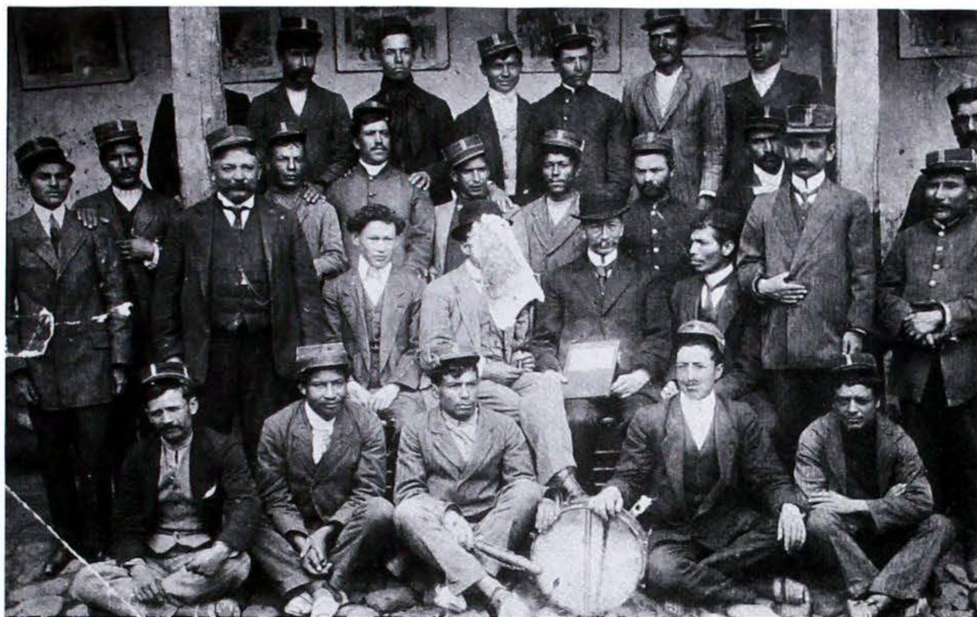
Policía, 1916 (en: Pasto a través de la fotografía , Pasto, 1987).

Por su parte, los civiles eran muy conscientes de los aspectos no republicanos de este procedimiento. ¿Cómo podía ser considerado libre el voto de un soldado? ¿Cómo podía ser compatible el libre ejercicio de la elección política con la disciplina militar? ¿Cómo podía estar seguro el ciudadano civil de depositar su voto libremente si los soldados también votaban?