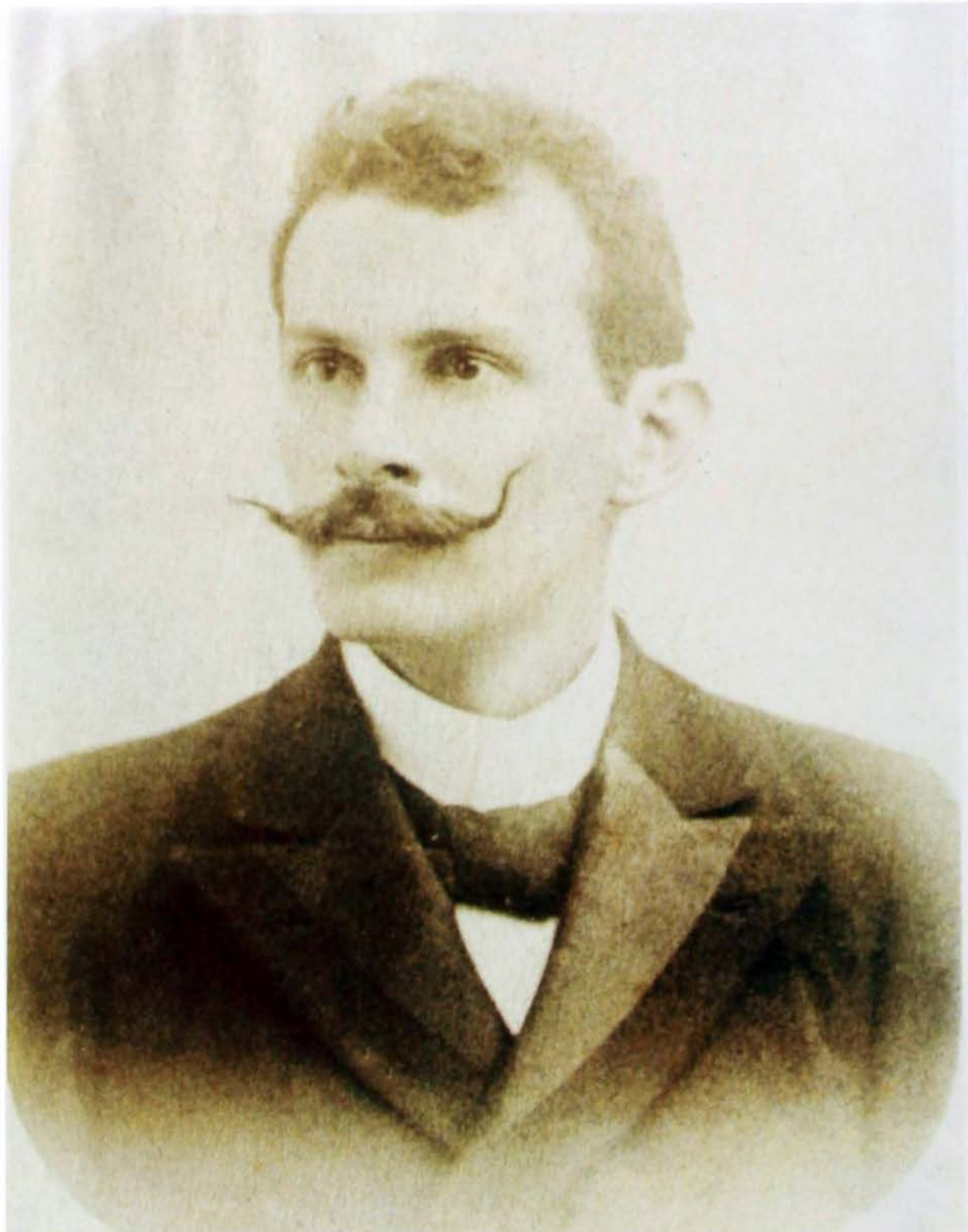
El pensador, militar y político liberal Rafael Uribe Uribe.

En tales casos la ayuda del clero se podía agradecer, pero no era casi necesaria. Había suficientes laicos del partido conservador entrenados para tales asuntos que eran perfectamente capaces de trabajar por su propia cuenta. Podía ser que en Colombia, como en Irlanda, la participación de la Iglesia fuera más secundaria de lo que se ha creído posteriormente.