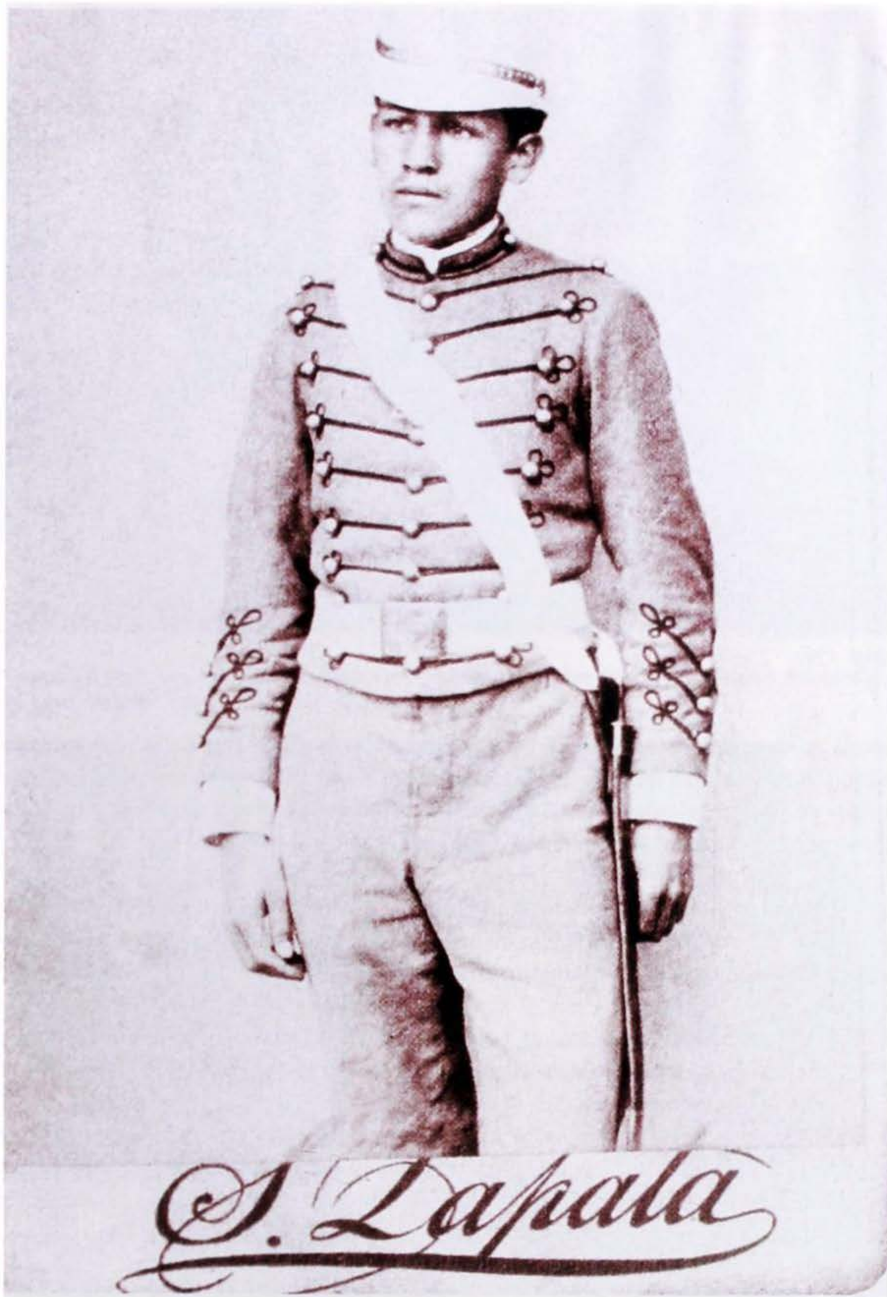
Tarjeta de visita con retrato de un soldado (tomada de: Eduardo Serrano, Historia de la fotografía en Colombia , MAM, Bogotá, 1983, pág. 102).

elecciones, con el fin de disuadir a los coalicionistas, lo que fue el pretexto para que la prensa capitalina escribiera artículos candentes sobre "matronas distinguidas y llevadas a la picota" y "conmociones bárbaras presididas por procesiones místicas y bandas infernales"... y otras expresiones del repertorio sectario, abundante y barato porque no cuesta nada 21 .