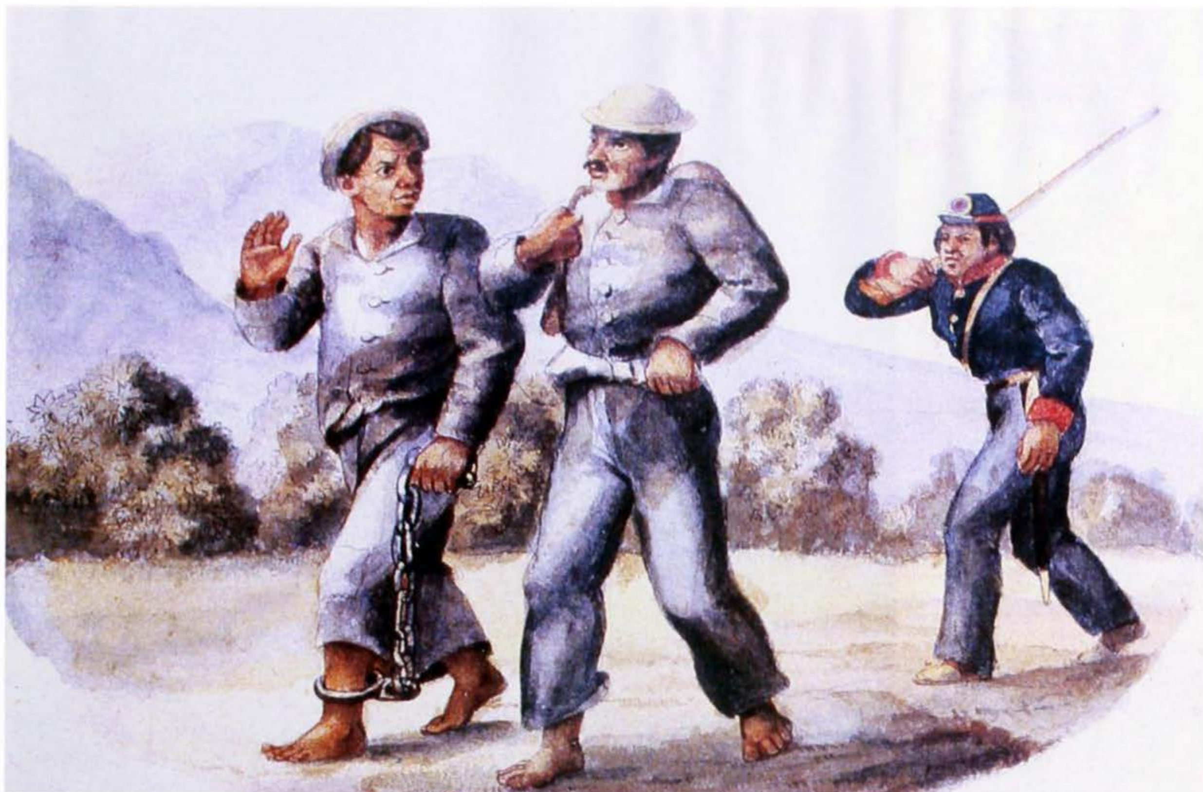
Presidarios de Bogotá. Acuarela de Ramón Torres Méndez (en: Fundación Misión Colombia, Historia de Bogotá, siglo XIX , Bogotá, 1988, pág. 51).

compiladores 14 . Entonces uno llega a dudar no de todo el asunto sino del enfoque particular que se le ha dado.