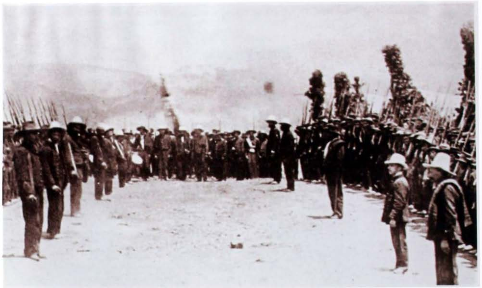
Ejército conservador en vísperas de la batalla de Palonegro, 1900.