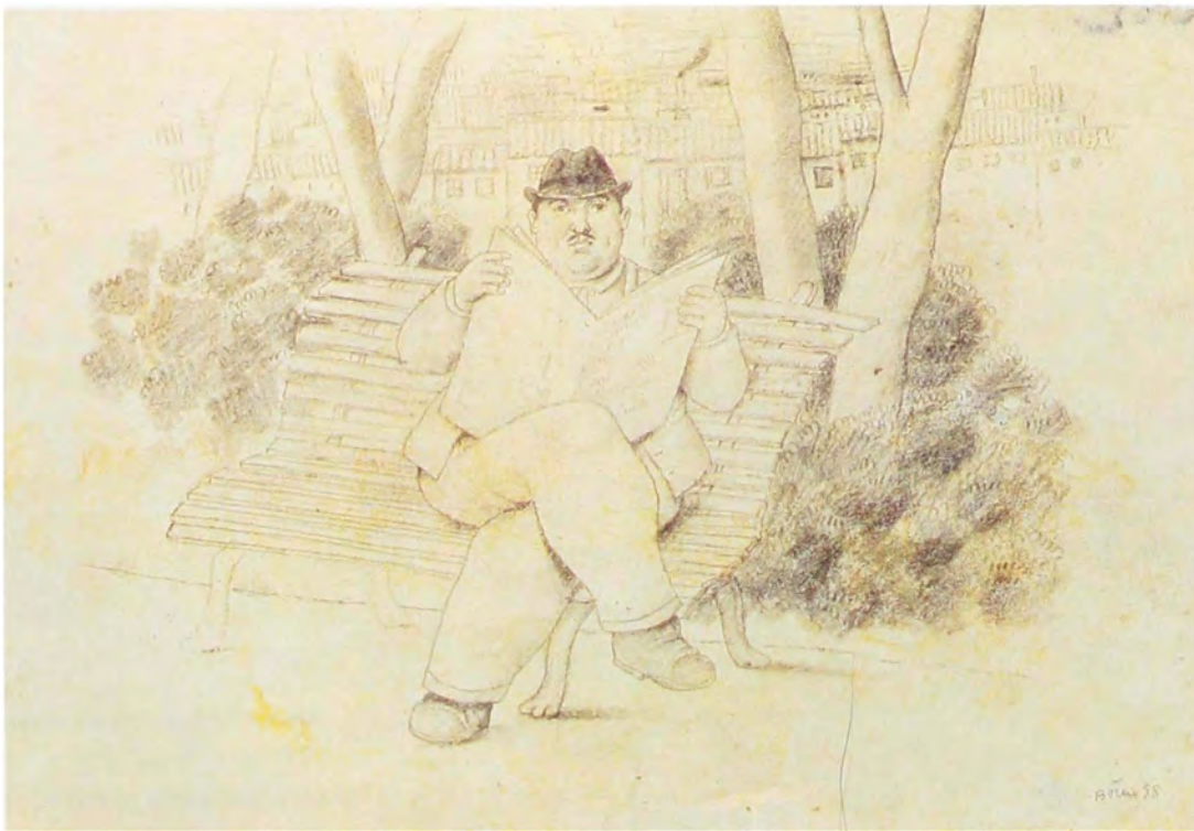
Hombre leyendo el periódico 1998 Lápiz sobre papel 40 x 55 cm