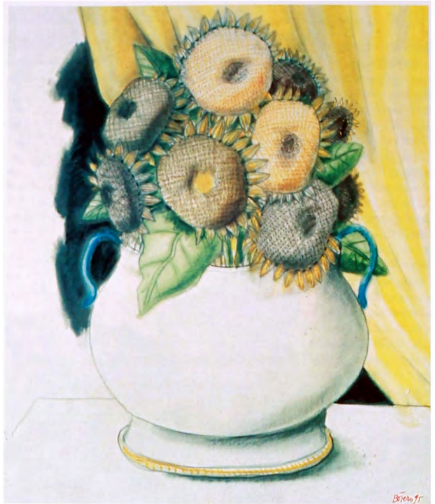
Girasoles 1995 Lápiz y acuarela sobre tela 101 x 132 cm