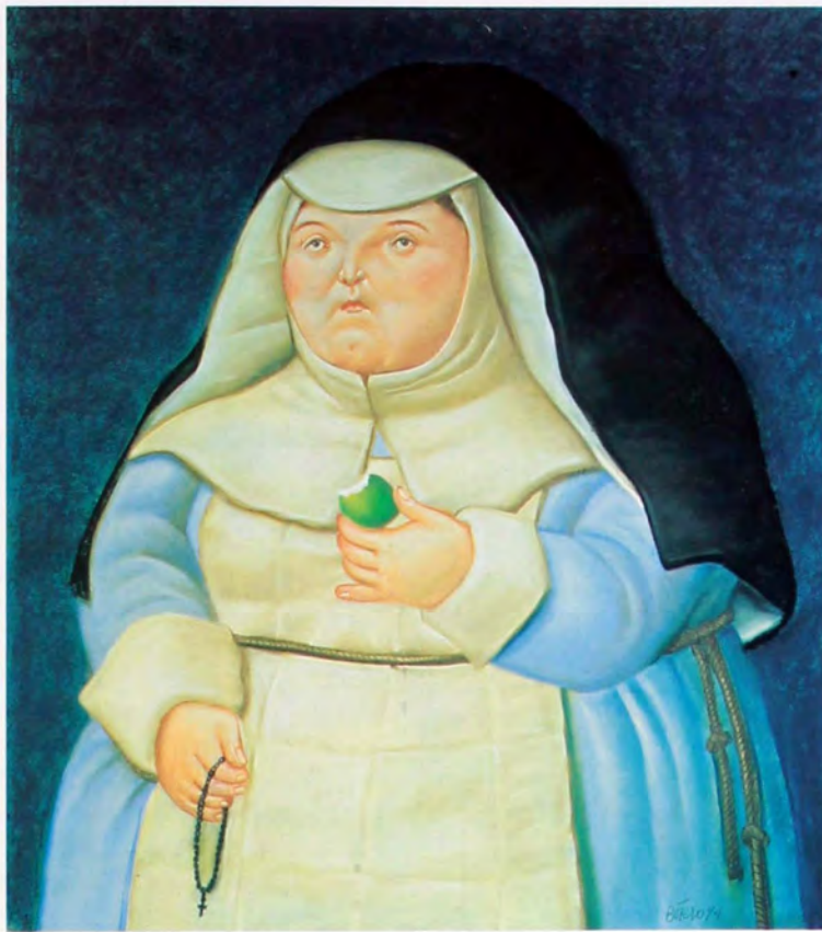
Madre superiora 1994 Pastel sobre papel 77 x 97 cm