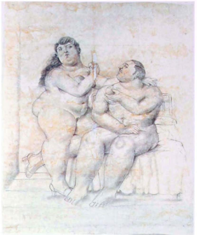
Adán y Eva 1990 Lápiz sobre papel 96 x 76 cm