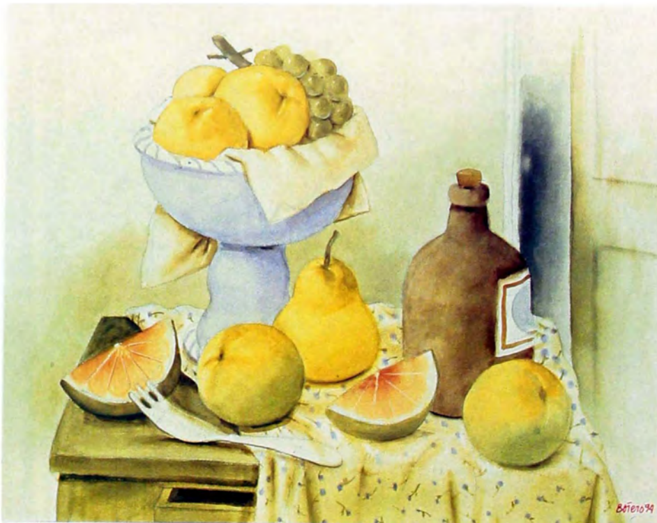
Naturaleza muerta con frutas y botella 1994 Acuarela sobre papel 78 x 97 cm