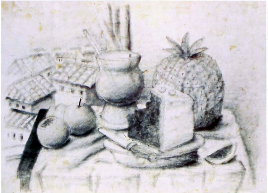
Naturaleza muerta con ponqué 1990 Lápiz sobre papel 79 x 103 cm