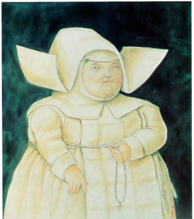
Madre superiora 1996 Lápiz y acuarela sobre tela 124 x 103 cm