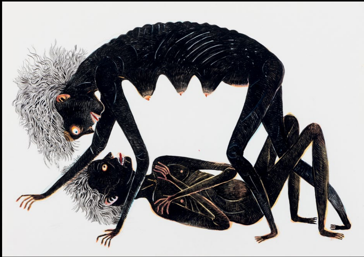
▲ Sin título 2020 Acuarela y tinta sobre papel 21,5 x 28 cm