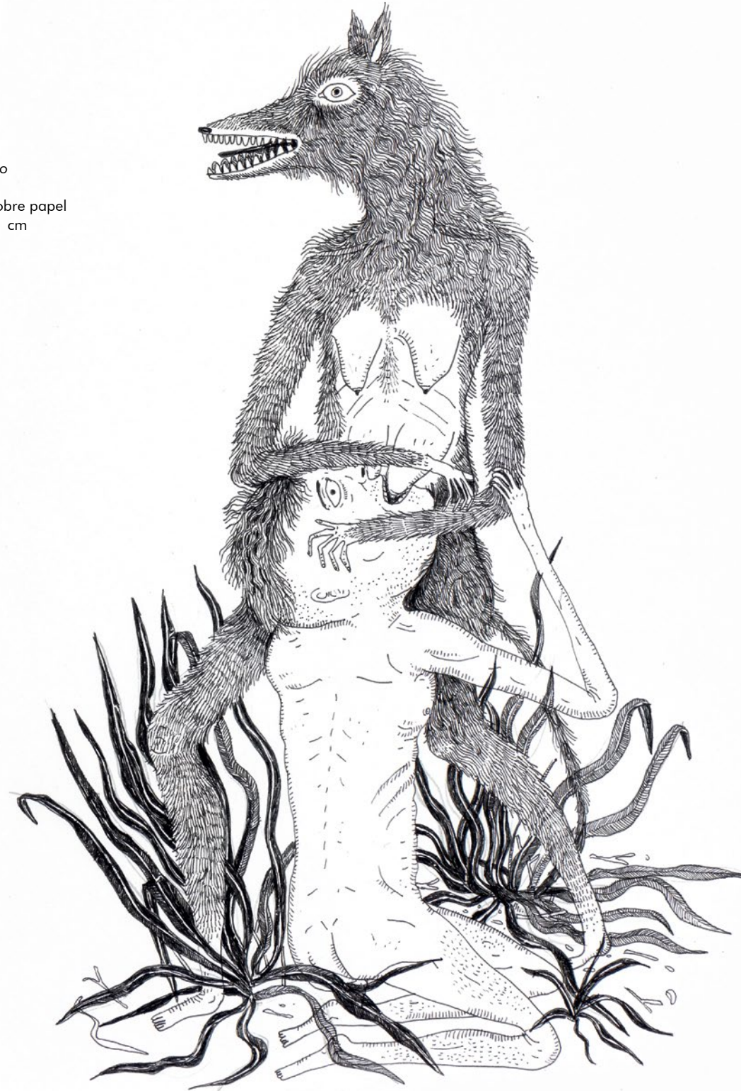
>> Sin título 2018 Tinta sobre papel 24 x 21 cm