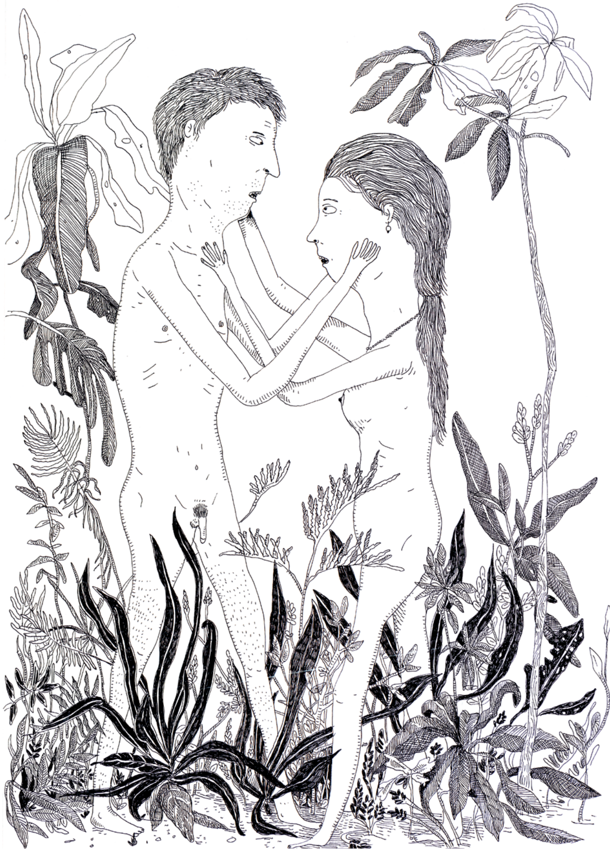
^ Sin título 2015 Tinta sobre papel 31 x 21 cm