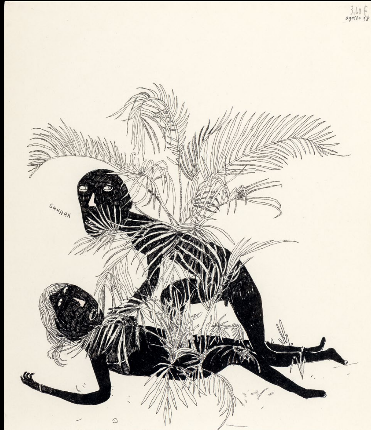
▲ Shhh 2015 Acuarela y tinta sobre papel 24 x 21 cm