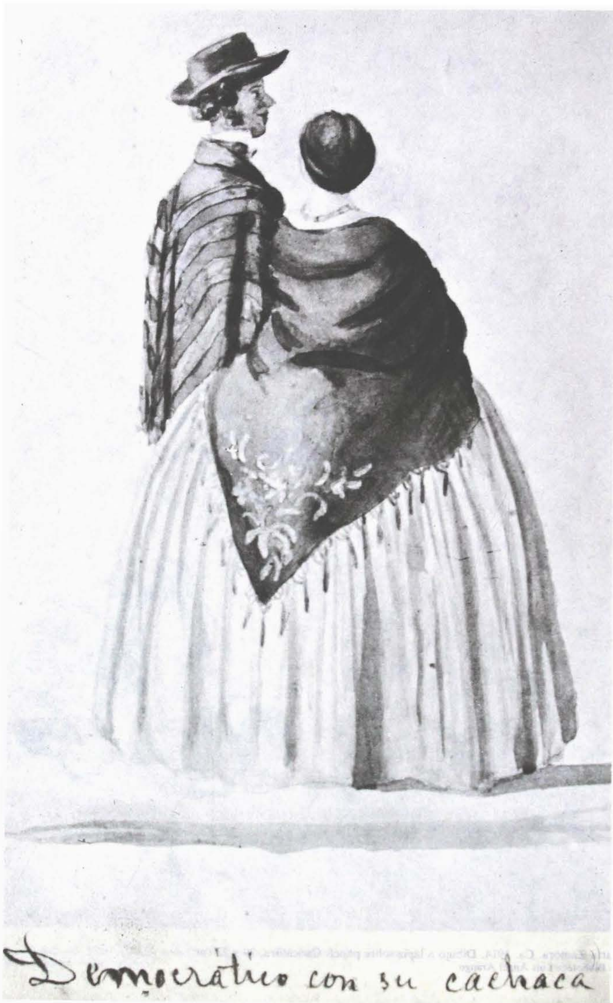
El democrático con su cachaca , s.f. Acuarela sobre papel, 35 x 25 cm. Colección particular.