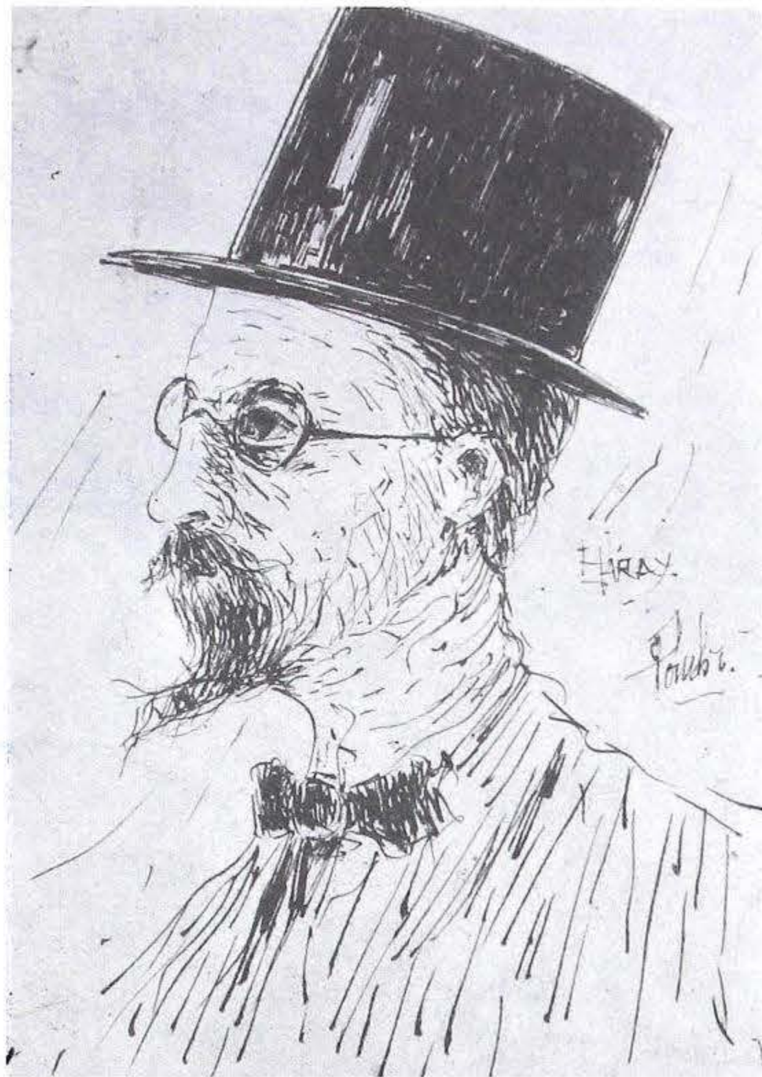
Rafael Pombo, s.f. Dibujo a tinta china sobre papel. Caricatura, 30 x 20 cm. Colección Biblioteca Luis Ángel Arango.