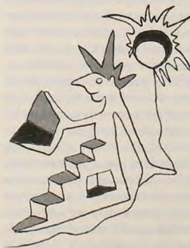
Leyendo sus ensayos sobre algunas novelas de Tomás Carrasquilla y

o, al menos, sin intentarlo. Sin entender las diferencias sociales entre Vanves y Saint-Denis. No siempre se tropieza con un buen profesor director de tesis y en muchas ocasiones se trata de señores que aprendieron a edificar un prestigio internacional aprovechándose de la inteligencia y la aplicación de sus alumnos latinoamericanos. El modelo y la síntesis las fabrican en Europa, el trabajo laborioso y empírico de validación de esos modelos es nuestra fatalidad. De todos modos admitamos que el contacto con Europa nos permite comunicarnos con tradiciones académicas de largo aliento, con recursos bibliográficos insospechados y con gente de inmensa generosidad humana e intelectual. Aprendemos a relativizarnos y compararnos, ganamos en el repertorio de análisis; entendemos y apreciamos mejor lo que tenemos y también entendemos por qué algunas cosas jamás las tendremos. Sin embargo, en esta reflexión cabe bien detenerse en lo que dice el propio Gómez García en su semblanza del maestro Gutiérrez Girardot; en comparación con Europa, el intelectual latinoamericano se sitúa de una manera peculiar; su pensamiento y escritura son menos cómodos, menos ordenados y sistemáticos. Con menos recursos y menos peso de una tradición, elabora con mayor heterodoxia y tiene una más natural propensión a la disidencia.