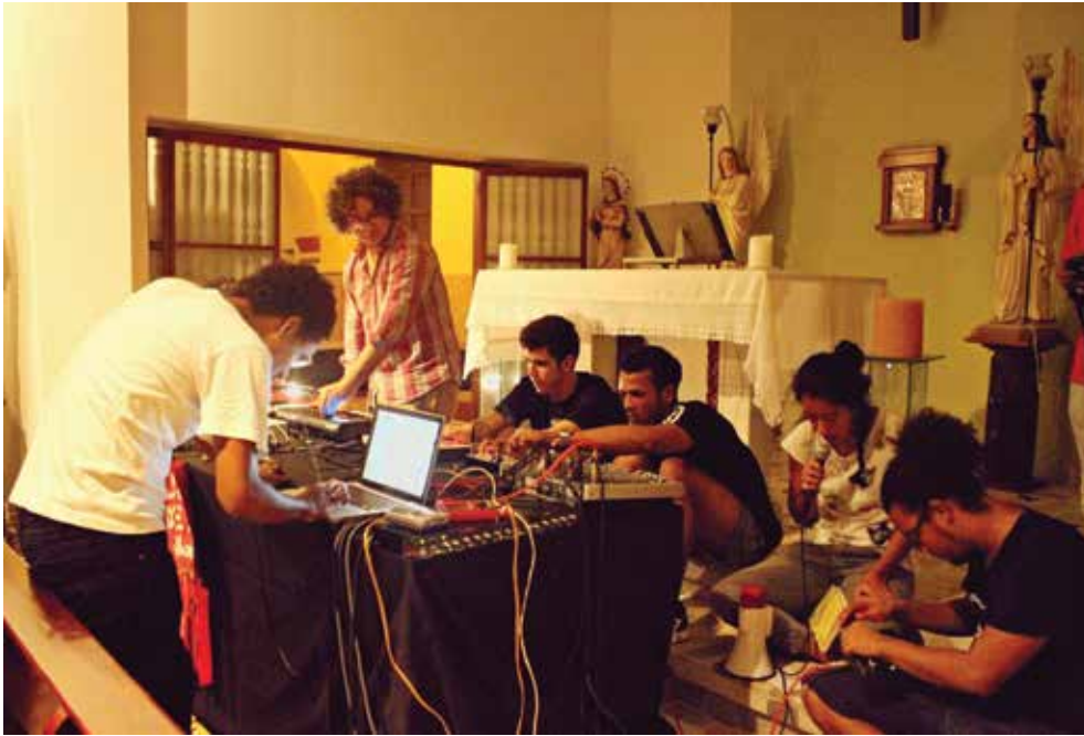
Colectivo Octavo Plástico en el Día Mundial de la Escucha, jornada que reflexiona sobre la ecología acústica, el paisaje sonoro y otros temas del universo sonoro.

En Colombia ha habido un crecimiento rápido en cuanto a iniciativas de autogestión que buscan no solo esquivar la intermediación de las disqueras tradicionales, sino también escapar al paso obligado por la capital para acceder a espacios de circulación y distribución, y en ello Internet ha sido clave. En el capítulo de los Netlabels , una de las ciudades que ha aportado significativamente es Medellín, de donde reseñamos tres sellos que tienen claro que lo importante no es ser descomunales sino, por el contrario, aprovechar nichos para crear zonas de circulación. El ejemplo más antiguo es Series Media ( http://www.seriesmedia.org/5 ), sello creado en 2003 (en un momento en que también en el mundo poco se hablaba de Netlabels ), y que surgió para resolver las necesidades puntuales de un grupo de artistas que querían acceder al público de manera más directa a través de reproducciones caseras en CD. Luego de varios altibajos, la aventura toma la forma de sello con la idea de no temerle a las grandes disqueras y de distribución gratuita. Actualmente combina las dos modalidades de publicación, en Internet y en CD. Si bien el grueso de artistas de su catálogo es de Medellín, con el tiempo les han dado cabida a artistas internacionales. Cuenta con un catálogo de cuarenta y un publicaciones en Netlabel y trece en CD. En cuanto a la línea musical, el sello incluye electrónica en la rama DJ, jazz y experimental que se almacenan en su propio sitio.