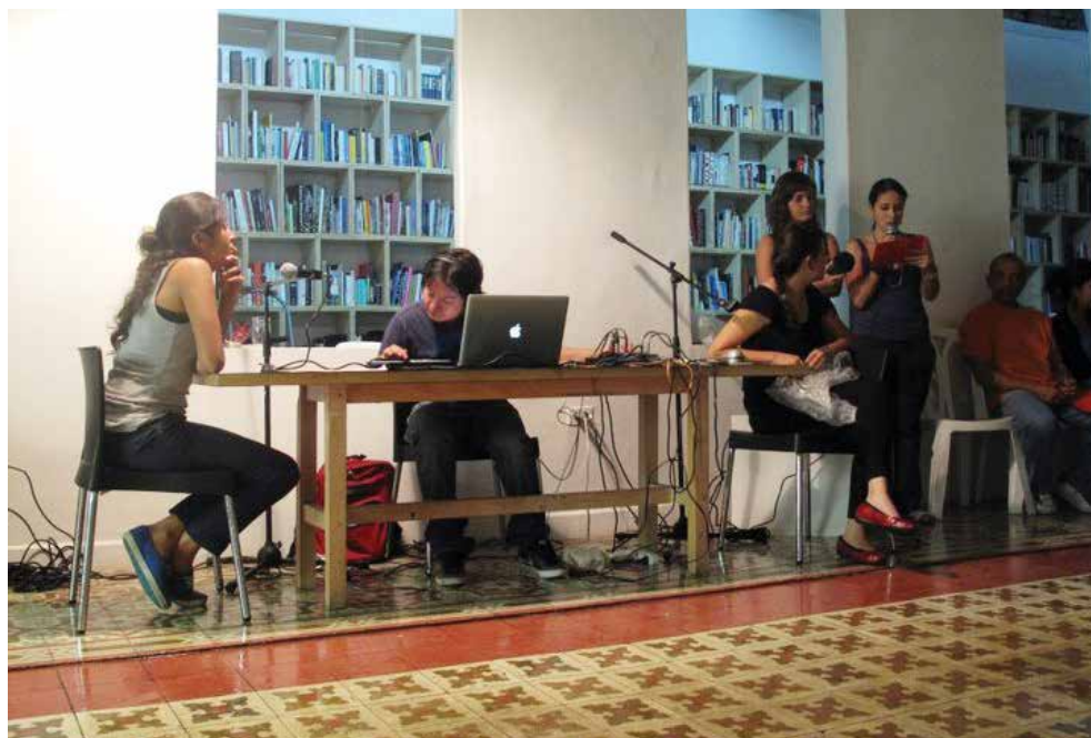
Colectivo NoisRadio.

que usualmente es de elaboración individual. Aunque cada persona compone de manera solitaria sus aportes, el resultado es colectivo y colaborativo.