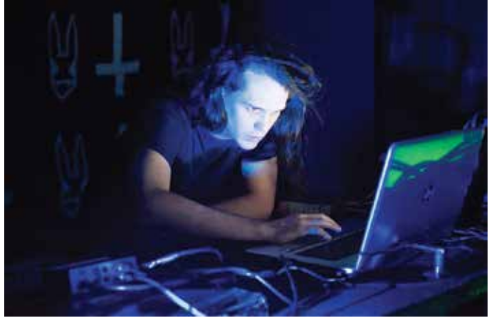
ARRIBA Cardenal en una presentación en Medellín.