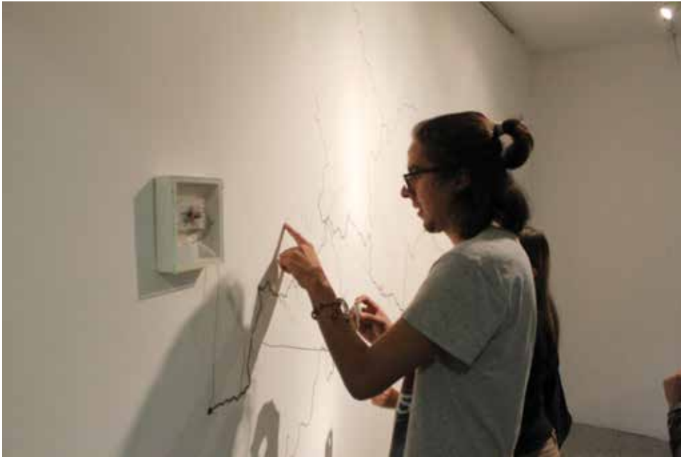
Andrés Cuartas, Paisaje fragmentado (2014). Ha desarrollado su creación en los campos del arte sonoro, el videoarte y el videoperformance .