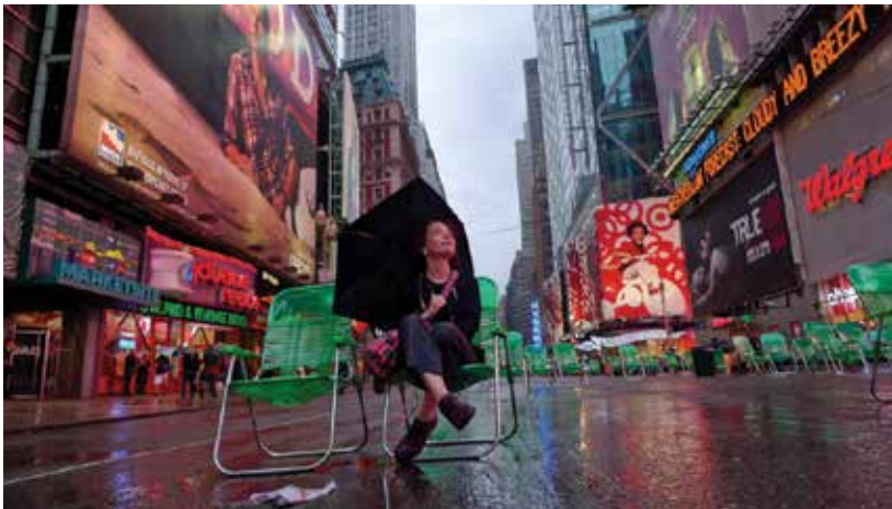
La cantante Lucía Pulido posee una de las voces más ricas de la música latinoamericana actual.