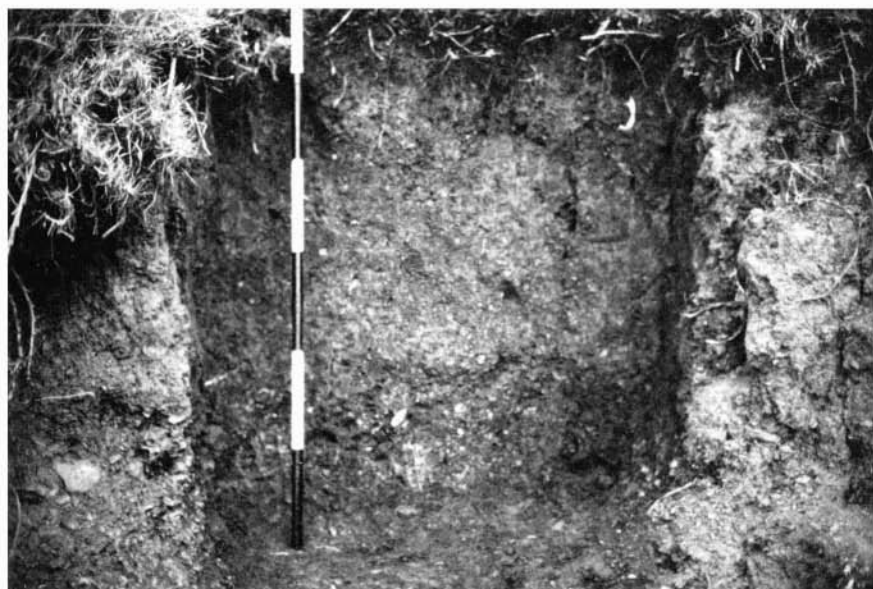
Corte sitio Bura donde se rescataron muestras para C14.