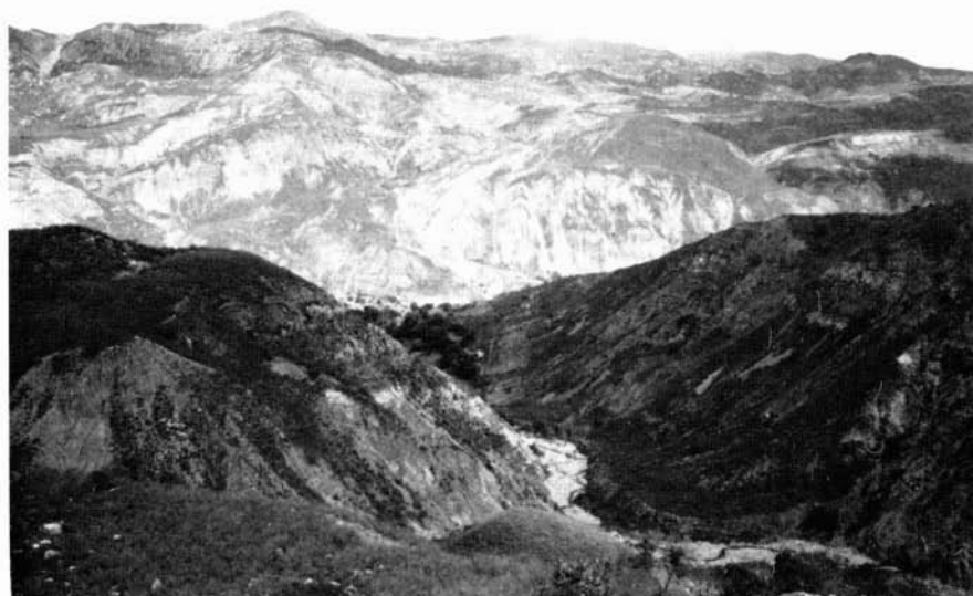
Aspecto del Cañón del río Chicamocha.